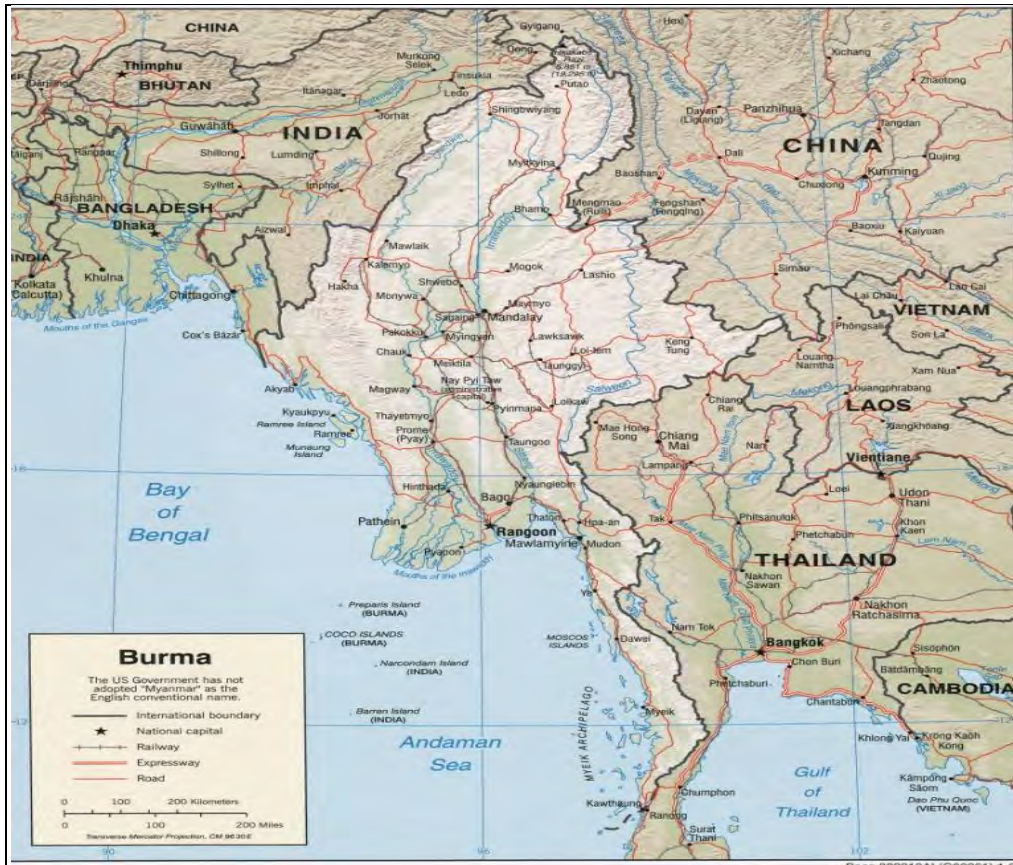
ภาพที่ 3 แผนที่สาธารณรัฐแห่งสหภาพเมียนมาร์

ที่มา : http://www.lib.utexas.edu/maps/middle_east_and_asia/txu-oclc-124072554-burma_pol_2007.jpg