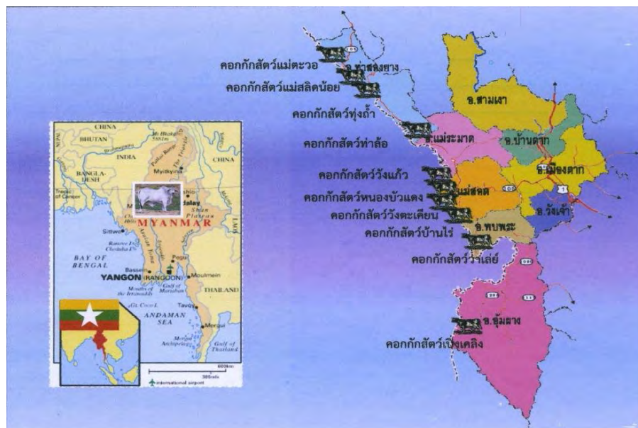
ภาพที่ 4 คอกพักสัตว์เอกชนริมชายแดนจังหวัดตาก