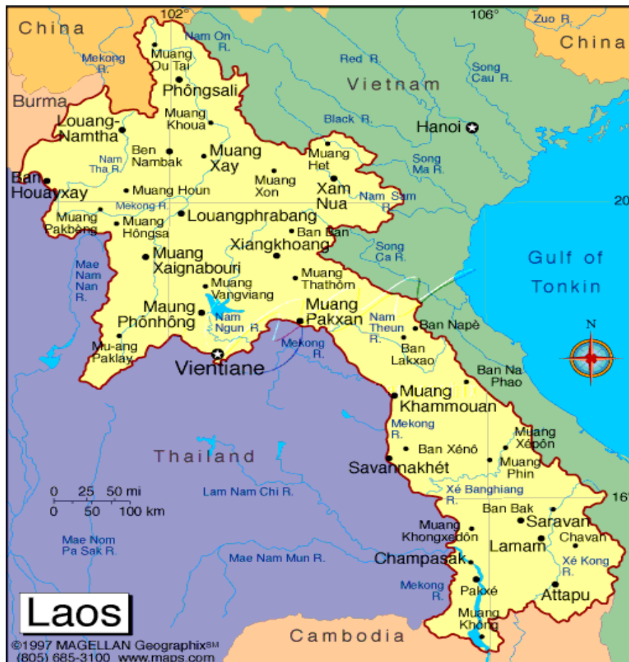
ภาพที่ 3.2.1 แผนที่สาธารณรัฐประชาธิปไตยประชาชนลาว