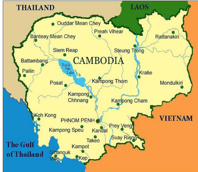
ภาพที่ 3.1.1 แผนที่ราชอาณาจักรกัมพูชา