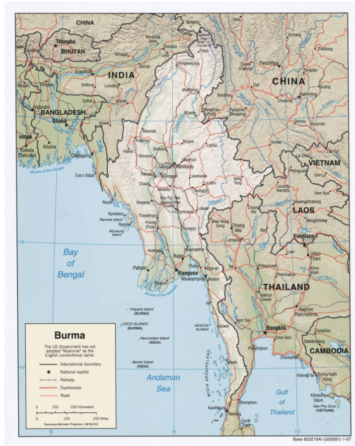
ภาพที่ 3.3.1 แผนที่สาธารณรัฐแห่งสหภาพเมียนมาร์