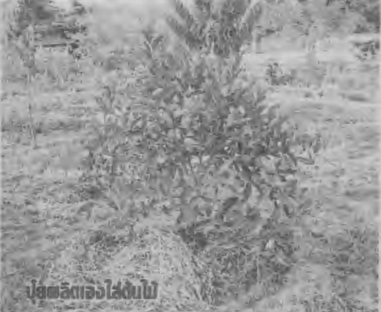
ปอดสัตว์ของไส้ดิน