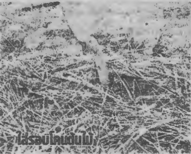
ใส่สอปโคโคมูล

ส่วนผสมในการทำปุ๋ยหมัก 1 คัน ประกอบด้วยใบไม้แห้ง 1,000 กิโลกรัม มูล สัตว์ 200 กิโลกรัม ปุ๋ยไนโตรเจน 2 กิโล กรัม สารเร่งจุลชีพ พด. 11 ของ ขึ้นตอน การทำปุ๋ยหมัก เริ่มละลายสารเร่งจุลชีพ