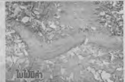
ใบไม้ปูลา