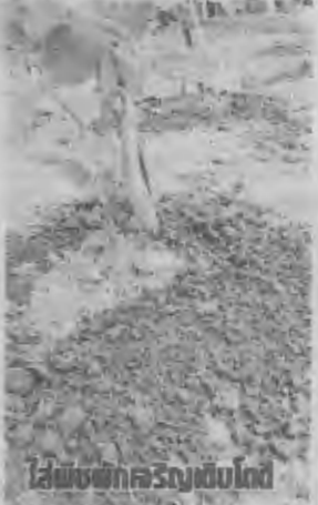
ใส่พืชผักเจริญเติบโต

พด. 1 ในน้ำ 20 ลิตร คนให้เข้ากันนาน 10-15 นาที เพื่อกระตุ้นให้จุลินทรีย์ออกจากสภาพ ฝอยและพร้อมที่จะเกิดกิจกรรมการย่อย สลาย การกองชั้นจะมีขนาดกว้าง 2x3 ม. สูง 30-40 ซม. ย่ำให้พอแน่นและรดน้ำให้ ชุ่ม นำมูลสัตว์มาโรยที่ผิวหน้าเศษพืชโรยปุ๋ย ไนโตรเจนทับบนชั้นของมูลสัตว์ ราดสาร ละลายจุลชีพ พด.1 ให้ทั่ว หลังจากนั้นนำ เศษพืชมากองทับเพื่อทำชั้นต่อไป โดยทำ เหมือนการกองชั้นแรก ทำเช่นนี้อีก 3-4 ชั้น ชั้นบนสุดของกองปุ๋ยปิดทับด้วยมูลสัตว์ หรือ ดินค้ำทหน้าประมาณ 1 นิ้ว เพื่อป้องกันการสูญ เสียความชื้น ทั้งนี้สามารถแยกเป็นกอง เล็ก ๆ ได้โดยการลดส่วนผสมต่าง ๆ ลงตาม อัตราส่วน