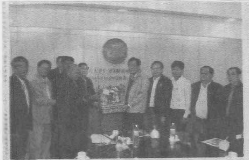
ขบวนการสหกรณ์...ดร.จุมพล สงวนสิน อธิบดีกรมส่งเสริมสหกรณ์ ให้การต้อนรับ กลุ่มสหกรณ์ในจังหวัดสมุทรสาคร จังหวัดสมุทรสงคราม จังหวัดเพชรบุรี ได้แก่ สหกรณ์กรุงเทพ จำกัด สหกรณ์การเกษตรนาเกลือสมุทรสาคร จำกัด สหกรณ์ การเกษตรนาเกลือสมุทรสงคราม จำกัด และกลุ่มเกษตรกรนาเกลือ บ้านแหลม จำกัด เดินทางมาร่วมอวยพรเนื่องในโอกาสวันขึ้นปีใหม่ พร้อมหารือแนวทางสนับสนุนการ พัฒนาสหกรณ์ ณ กรมส่งเสริมสหกรณ์ เทเวศร์ เมื่อเร็วๆ นี้