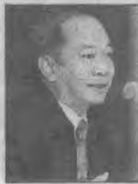
ทฤษฎี ชาวสวนเจริญ

ไข้หวัดนกให้เข้าควบคุม โรคในพื้นที่ทันที และ ได้สั่งให้ด่านกักสัตว์ ตามแนวชายแดนทุก ด่านร่วมกับหน่วยงาน ที่เกี่ยวข้องทั้งทหาร ตำรวจ ชุดกักการเข้ มงวดตรวจสอบบุคคล เข้าออกต้องไม่มี การนำสัตว์ปีกหรือ