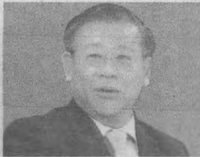
ยุคล ลิมแหลมทอง

โดยน้ำส่วนนี้จะต้องใช้สนับสนุนกิจกรรมทุกอย่าง ทั้งการอุปโภคบริโภค รักษาระบบนิเวศน์ เพื่อการเกษตรและอุตสาหกรรมในระยะเวลากว่า 3 เดือนข้างหน้าหรือจนถึงสิ้นเดือนพฤษภาคม ซึ่งต้องบริหารอย่าง