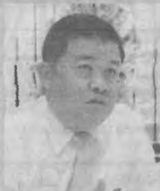
ดร.จิระจรณ์ ทรัพย์สงสอง อธิบดีกรมตรวจบัญชีสหกรณ์

ภาคสหกรณ์ ถือเป็น กลไกสำคัญอย่างหนึ่งที่ ช่วยขับเคลื่อนเศรษฐกิจ ของประเทศ ตั้งแต่ปี 2556 ที่ผ่านมา ภาคสหกรณ์ไทย จะมีความเสี่ยงทางธุรกิจ หลายด้าน ตลอดจน สถานการณ์ทางการเมือง ที่เปราะบาง ซึ่งส่งผลต่อ การบริโภคและการลงทุนด้วย ทำให้ต้นทุนเพิ่มสูงขึ้น แต่