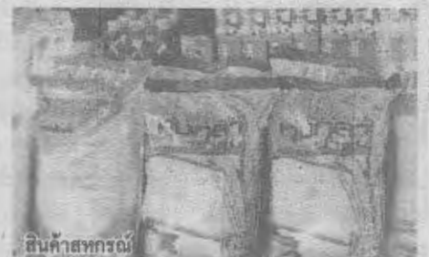
สินค้าสหกรณ์

โดยทั้ง 5 ยุทธศาสตร์ถือเป็นนโยบายสำคัญและเร่งด่วนที่หน่วยงานที่เกี่ยวข้องต้องร่วมมือกันดำเนินการ คาดว่าจะเป็นแนวทางช่วยเหลือแพร่ผลกระทบดีแก่เกษตรกร และวิธีการสหกรณ์ให้เป็นที่รู้จักและมีความเข้าใจอย่างแพร่หลาย ตลอดจนสามารถนำไปใช้ในวิถีชีวิตของประชาชนไทยเพิ่มมากขึ้นในอนาคต ซึ่งจะช่วยลดปัญหาทุจริตและคอร์รัปชันได้ ภายใต้วิสัยทัศน์ของกรมที่มุ่งพัฒนาสหกรณ์และกลุ่มเกษตรกรให้เกิดความเข้มแข็ง มี