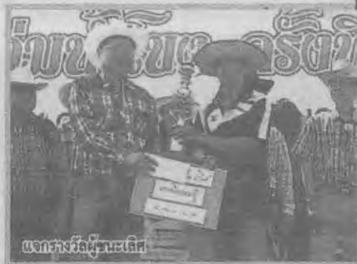
แจกรางวัลผู้ชนะเลิศ