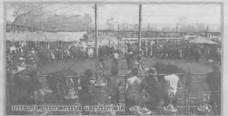
บรรยากาศประกวดกระบือ และประกวดโค

รวมทั้งเกษตรกร ประชาชน ร่วมกิจกรรมนับ พันคน