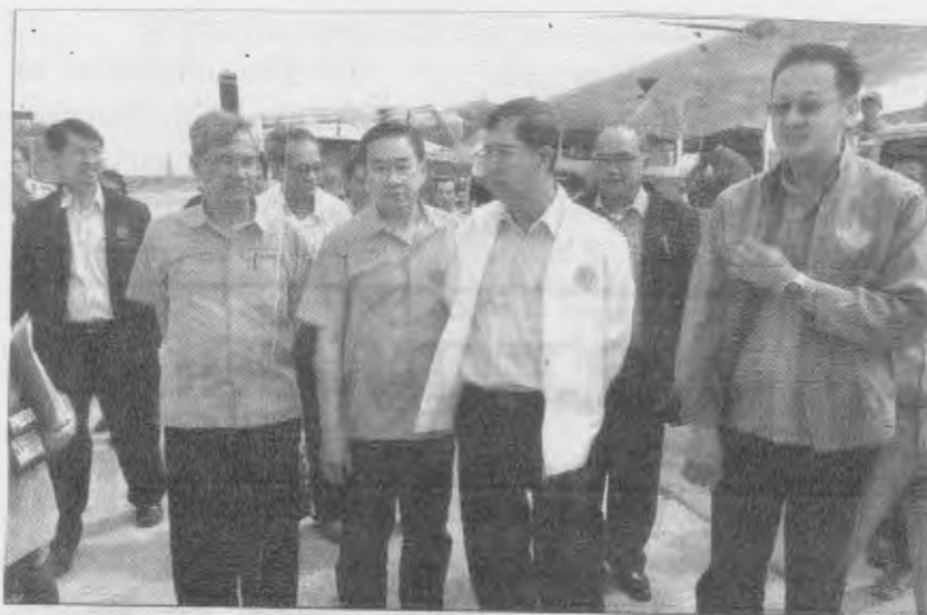
รมมือแดง : นายชวลิต ชูขจร ปลัดกระทรวงเกษตรและสหกรณ์ พร้อม นายสุรสิทธิ์ กิตติณตจินดา รองอธิบดีกรมฝนหลวงและการบินเกษตร ออกติดตามการจัดตั้งหน่วยปฏิบัติการฝนหลวงเคลื่อนที่เร็วเพื่อเตรียมพร้อมรับมือภัยแล้งในปี 2557 ที่สนามบินเกษตร จ.นครสวรรค์ เมื่อเร็วๆ นี้