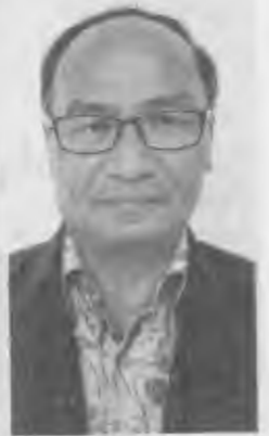
อาทิตย์ มติธรรม