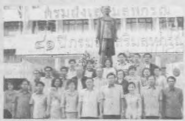
และกรมตรวจบัญชีสหกรณ์ ร่วมวางพานพุ่ม ณ กรมส่งเสริมสหกรณ์ เทเวศร์

ในโอกาสนี้ได้ประมวลภาพการจัดงานวันสหกรณ์แห่งชาติ ประจำปี 2557 ได้แก่