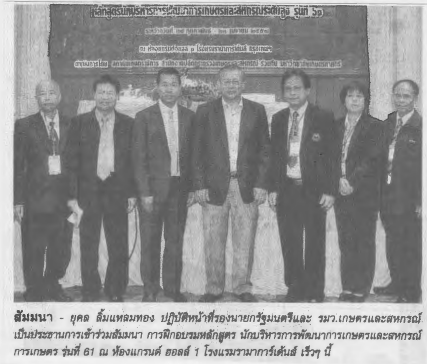
สัมมนา - บุคคล สัมผัสลมทอง ปฏิบัติหน้าที่รองนายกรัฐมนตรีและ รมว.เกษตรและสหกรณ์ เป็นประธานการเข้าร่วมสัมมนา การฝึกอบรมหลักสูตร นักบริหารการพัฒนาการเกษตรและสหกรณ์ การเกษตร รุ่นที่ 61 ณ ห้องแกรนด์ ฮอลล์ 1 โรงแรมรามาคารีเด็นส์ เร็วๆ นี้