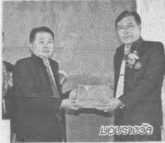
12 กุมภาพันธ์ 2557 จังหวัดขอนแก่น ภาคเหนือ วันที่ 24 กุมภาพันธ์ 2557 จังหวัดเชียงใหม่ ส่วนภาคกลางจะจัด ขึ้นในวันที่ 7 มีนาคม 2557 ณ อิมแพ็ค