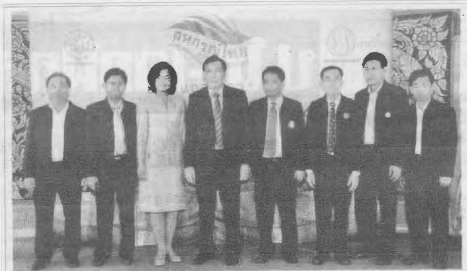
สิ้นค้าสหกรณ์-ดร.จุมพล สงวนสิน (ที่ 4 จากซ้าย) อธิบดีกรมส่งเสริมสหกรณ์ เป็นประธานแถลงข่าวการจัดงานมหกรรมสิ้นค้าสหกรณ์ ประจำปี 2557 ภายใต้หัวข้อ "สหกรณ์ไทยสร้างเศรษฐกิจไทย" ซึ่งจัดขึ้นระหว่างวันที่ 4-8 มี.ค. ณ ชาเลนเจอร์ 3 อิมแพ็ค เมืองทองธานี