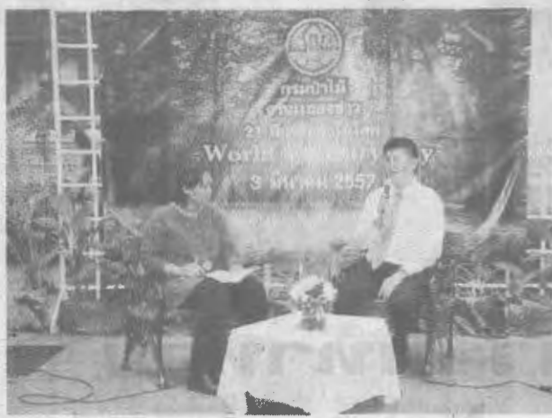
แสดงข่าว "วันป่าไม้โลก"...นายบุญชอบ สุทธมนัสวงษ์ อธิบดีกรมป่าไม้ เป็นประธานในการแถลงข่าว "วันป่าไม้โลก" รณรงค์ให้ประชาชนและสังคมเห็นความสำคัญของ "ไม้พะยูน" เผยชวนการปลูกต้นไม้ที่พยายามจะตัดไม้ไม่เว้นกระทั่งในวัด

เกาะคิดความเคลื่อนไหวแวดวงเกษตรทรัพยากรธรรมชาติและสิ่งแวดล้อมทั่วไทย...นสพ.บ้านเมือง ประจำวันพุธที่ 6 มีนาคม 2557... ● ชาวแรก...นายวิชาญ สิมายา รองปลัดกระทรวงทรัพยากรธรรมชาติและสิ่งแวดล้อม ลงพื้นที่ตรวจราชการ ณ จังหวัดศรีสะเกษ และอุบลราชธานี เพื่อดูการปลูกต้นไม้พะยูนซึ่งเป็นปัญหาสำคัญที่จะต้องการแก้ไขโดยความร่วมมือ เนื่องจากมีการปลูกต้นไม้ในพื้นที่ป่าชุมชนและในพื้นที่วัด มีการ