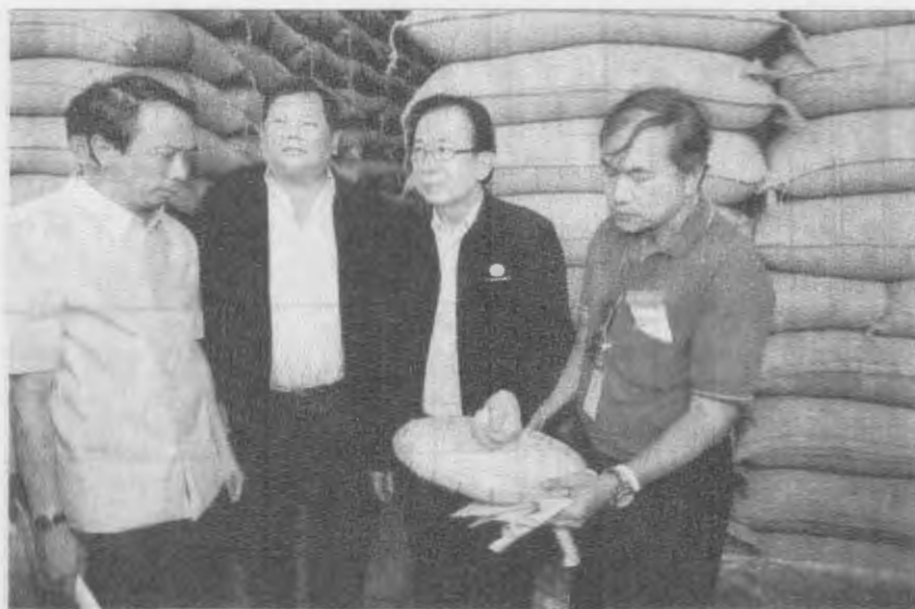
ตรวจคลัง - นายบรรณ พวงราช รมช.พาณิชย์ ตรวจคลังข้าวที่เก็บข้าวของบริษัท นำชัยข้าวไทย จำกัด ต.โพธาราม อ.เมือง จ.สิงห์บุรี เพื่อเตรียมความพร้อมในการประมูต ข้าวในการเปิดตลาดขายส่งสินค้าเกษตรล่วงหน้า เมื่อวันที่ 8 มี.ค.