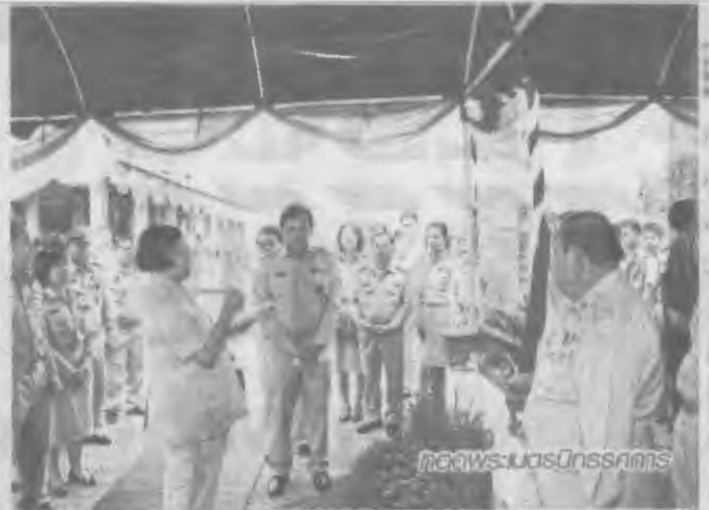
เปิดพระตำหนักกรม