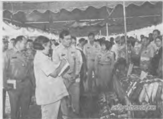
เปิดตลาดโรงเรียน