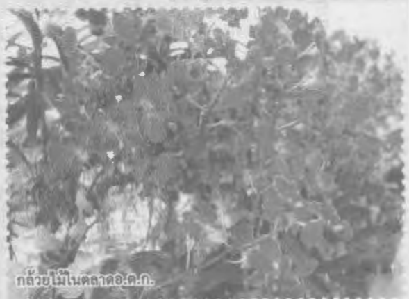
กล้วยไม้ในตลาดอ.ต.ก.

วงจร เพื่อให้ข้อมูลการตลาด แก่กลุ่มเป้าหมาย อันได้แก่ กลุ่มเกษตรกรผู้ผลิตกล้วยไม้ ผู้จำหน่ายกล้วยไม้ ไม้ดอก ไม้ประดับ อีกทั้งยังเป็นสถานที่เจรจาการค้า และส่งเสริมผลิตภัณฑ์กล้วยไม้ส่งออกให้เป็นโปรดัคท์แชมเปียน คอไปในอนาคต