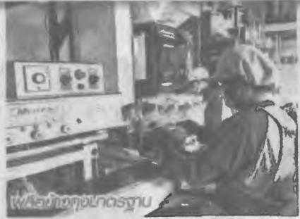
เปิดห้องคอมพิวเตอร์