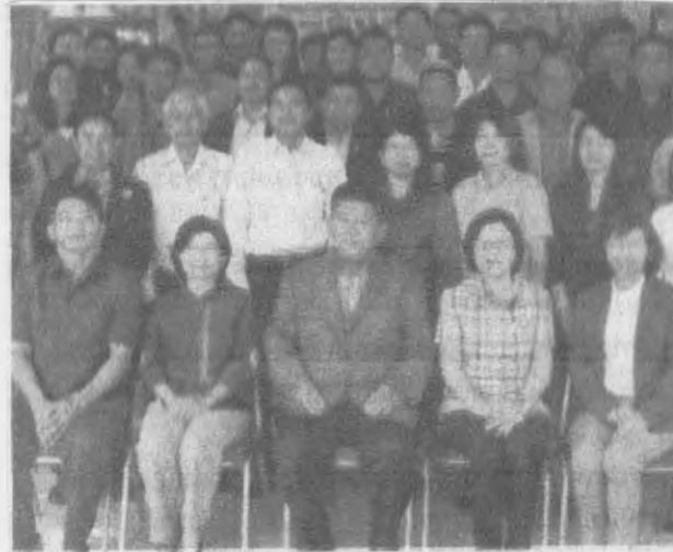
เปิดสัมมนา - ดำรงค์ จิระสุทัศน์ อธิบดีกรมวิชาการเกษตร เป็นประธานเปิดการสัมมนาเชิงปฏิบัติการ หลักสูตร การปฏิบัติงานภายใต้พระราชบัญญัติคุ้มครองพันธุ์พืชและกองทุนคุ้มครองพันธุ์พืชเพื่อรองรับการเข้าสู่ประชาคมเศรษฐกิจอาเซียน ครั้งที่ 5 ณ ห้องประชุมศูนย์วิจัยและพัฒนาการเกษตรภูเก็ต จ.ภูเก็ต