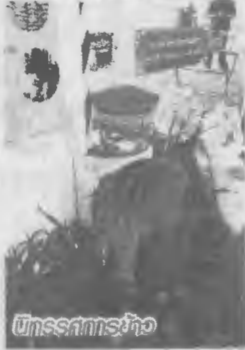
นิทรรศการข้าว

กรรมการและฝ่ายเจ้าหน้าที่โรงสี มีส่วนร่วมวางแผนการดำเนินงานควบคู่กับการส่งเสริมเกษตรกรในพื้นที่ผลิตข้าวเพื่อป้อนโรงสี ซึ่งในปีนี้ สมาชิกกลุ่มโรงสีข้าวมีการพัฒนารวมกลุ่มผู้ผลิต แบ่งเป็นกลุ่มผู้ผลิตข้าวปลอดภัย จำนวน 50 ราย พื้นที่ 231 ไร่ ผลิตข้าวปลอดภัยเพื่อจำหน่ายข้าวเปลือกให้โรงสีข้าวพระราชทาน โดยกรรมการข้าว ได้ให้การรับรองแปลง (GAP) มีกลุ่มผู้ ผลิตข้าวปลอดภัยบ้านคิ้ว จำนวน 10 ราย