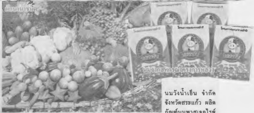
นมวัวน้ำเย็น จำกัด จังหวัดสระแก้ว ผลิตภัณฑ์ ภัณฑ์นมพาสเจอร์ไรซ์

โดยภายในงานจะมีร้านค้าจำหน่ายสินค้า ผลิตภัณฑ์ ที่มีลักษณะ ดี ปลอดภัย ประหยัด เนื้อ นม ไข่ และประมงจากสหกรณ์และกลุ่มเกษตรกรทั่วประเทศ ที่ผ่านการคัดเลือกมาให้ผู้บริโภคได้รู้จักและ ซบจำยในราคาที่โปร่งใส มีความปลอดภัย และได้ มาตรฐาน จำนวนกว่า 100 ร้านค้า เช่น ผลิตภัณฑ์ เนื้อโคขุนสดและปรุงสำเร็จ จากสหกรณ์โคเนื้อ มหาวิทยาลัยเกษตรศาสตร์กำแพงแสน จำกัด จังหวัด