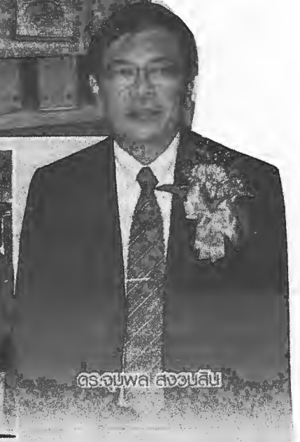
ดร.จุมพล สงวนสิน