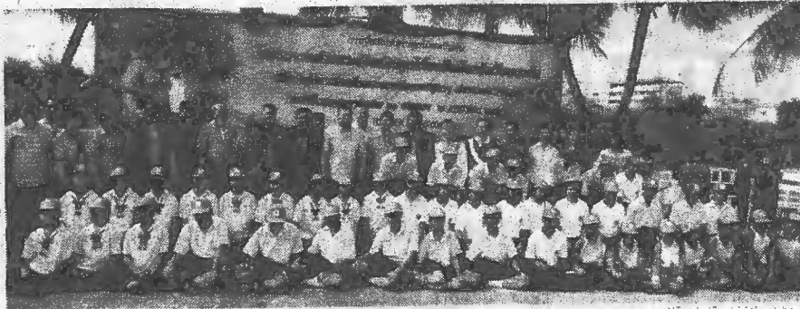
ยุคส ลิ้มแหลมทอง (ยืนแถวหน้าคนที่ 9 จากซ้าย) พร้อมด้วยผู้บริหารกรมต่างๆ และเกษตรกรร่วมงานวันรณรงค์ปลูกไม้ผลยืนต้นครัวเรือนละต้น ณ พิพิธภัณฑสถานแห่งชาติเกษตรเฉลิมพระเกียรติฯ

ยืนต้นละ 1 ต้น หากปลูกได้ทุกครัวเรือนจะได้ ต้นไม้ถึง 6 ล้านต้น หากคิดพื้นที่รวมจะมีถึง 2.4 แสนไร่ ไว้สำหรับไว้บริโภคภายในครัวเรือนเพื่อลดรายจ่ายและเพิ่มพื้นที่สีเขียวในชุมชน ซึ่งเป็นส่วนหนึ่งในการช่วยลดภาวะโลกร้อนด้วย