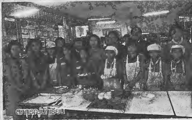
สหกรณ์นักเรียน