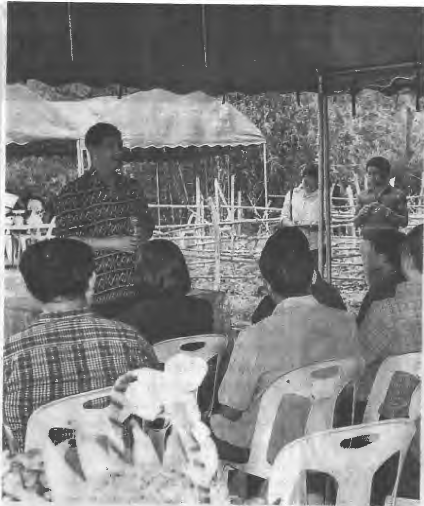
ลงพื้นที่ ชาวลิต ชูจร ปลัดกระทรวงเกษตรและสหกรณ์ ลงพื้นที่ติดตามสถานการณ์ภัยแล้ง พร้อมตรวจสอบสภาพพื้นที่ปลูกพืชฤดูแล้งของเกษตรกร ในพื้นที่ท้ายเขื่อนแม่กวงอุดมธารา จ.เชียงใหม่