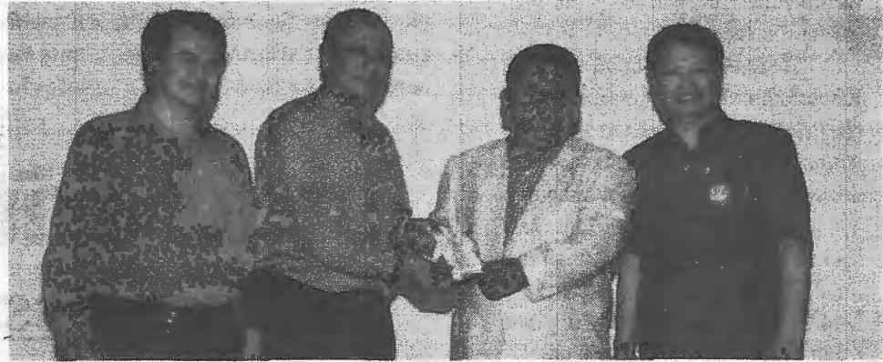
เปิดประชุมวิชาการประจำปี 2557 ● นายดำรง จิระสุทัศน์ อธิบดีกรมวิชาการเกษตร เป็นประธานในพิธีเปิดการประชุมวิชาการประจำปี 2557 สำนักวิจัยและพัฒนาการเกษตรเขตที่ 3 - 5 ภายใต้แนวคิด "จากผลงานวิจัยและการบริการ สู่นำไปใช้ประโยชน์" ณ โรงแรมระยองรีสอร์ท จังหวัดระยอง