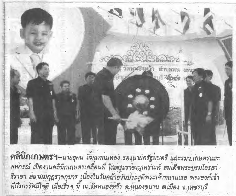
คลินิกเกษตรฯ-นายยุคล ลิ้มแหลมทอง รองนายกรัฐมนตรี และรมว.เกษตรและสหกรณ์ เปิดงานคลินิกเกษตรเคลื่อนที่ ในพระราชานุเคราะห์ สมเด็จพระบรมโอรสาธิราชฯ สยามมกุฎราชกุมาร เนื่องในวันคล้ายวันประสูติพระเจ้าหลานเธอ พระองค์เจ้าทีปังกรรัศมีโชติ เมื่อเร็วๆ นี้ ณ วัดหนองหว้า ต.หนองขนาน อ.เมือง จ.เพชรบุรี