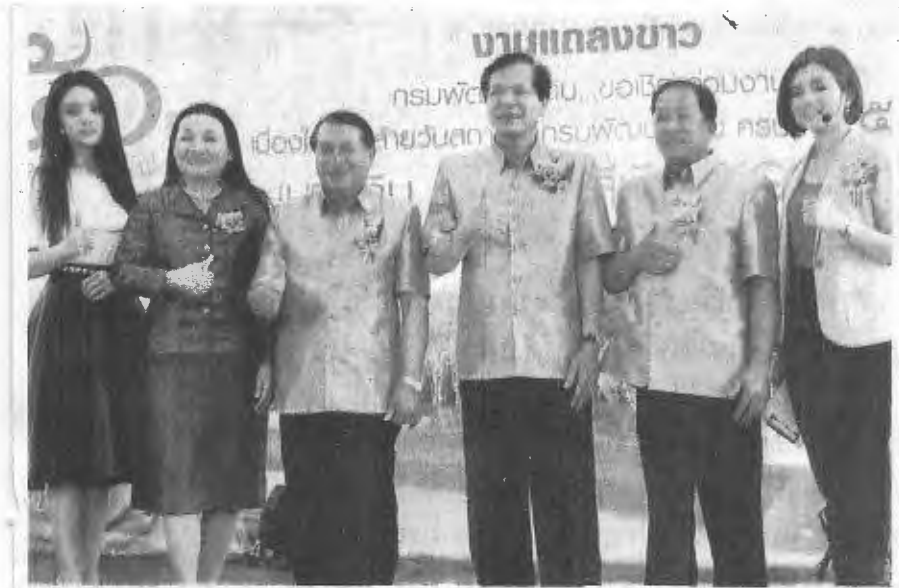
ครอบคลุม - อภิชาติ จงสฤทธ อธิบดีกรมพัฒนาที่ดิน แถลงจัดงานวันสถาปนากรมพัฒนาที่ดินครบรอบ 51 ปี แนวคิด "พัฒนาที่ดิน สู่เกษตรสีเขียว" ที่กรมพัฒนาที่ดิน อ.พหลโยธิน