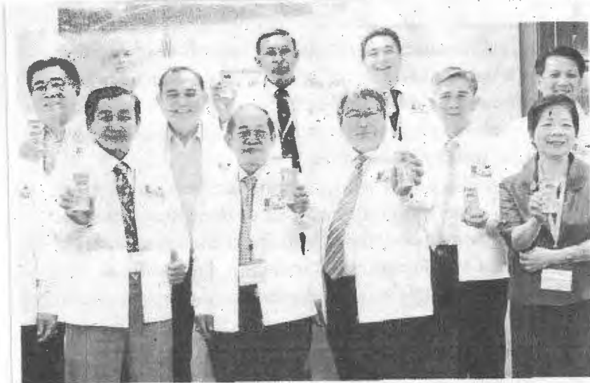
วันดีมนมโลก ทฤษฎี ชาวสวนเจริญ อธิบดีกรมปศุสัตว์ ร่วมมือกับองค์การอาหารและเกษตรแห่งสหประชาชาติ (เอฟเอโอ) องค์การส่งเสริมกิจการโคนมแห่งประเทศไทย (อสมท.) จัดงานวันดีมนมโลก "World Milk Day" ในวันที่ 1 มิ.ย.นี้ ที่ลานพาร์ค พารากอน เพื่อกระตุ้นและรณรงค์ให้คนไทยดื่มนมเพิ่มขึ้นเพื่อสุขภาพที่ดีขึ้น