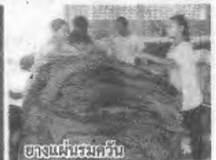
ขางแผ่นรมควัน เกษตรกรผู้ปลูกขาง ควรหันมาให้ความสำคัญในการลดต้นทุนการผลิตขางพาราควบคู่กับการ

71,000 ล้านบาท ซึ่งการดำเนินงานธุรกิจขางพาราของสหกรณ์และกลุ่มเกษตรกรในขณะนี้ นอกจากมีการดำเนินการในรูปแบบการรวบรวมผลผลิตขางพาราแล้ว ยังมีการแปรรูปเป็นขางรมควัน ขางอัดก้อน ขางแท่ง ขางคอมปาวด์และขางเคปร็อกอีกด้วย”