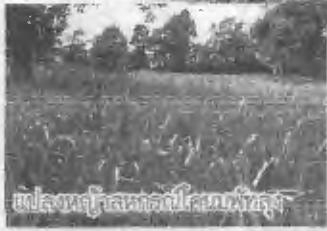
แปลงปลูกอาหารโคนมหยาง