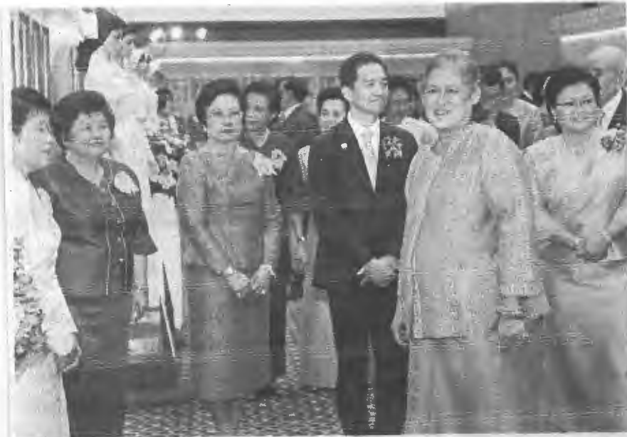
สมเด็จพระเทพรัตนราชสุดาฯ สยามบรมราชกุมารี เสด็จไปทรงเปิด โครงการงานฉลอง 100 ปี โรงพยาบาลจุฬาลงกรณ์ สภากาชาดไทย ณ ศูนย์การประชุม แห่งชาติสิริกิติ์ เขตคลองเตย