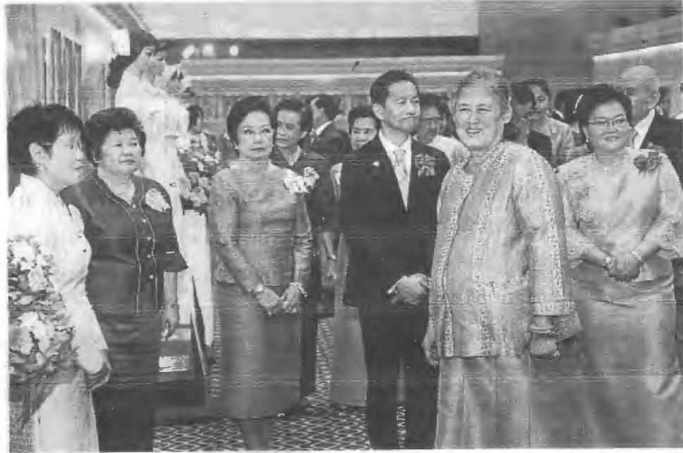
สมเด็จพระเทพรัตนราชสุดาฯ สยามบรมราชกุมารี เสด็จพระราชดำเนินไปทรง เปิด โครงการงานฉลอง 100 ปี โรงพยาบาลจุฬาลงกรณ์ สภากาชาดไทย ณ ศูนย์การ ประชุมแห่งชาติสิริกิติ์ เมื่อวันที่ 30 พฤษภาคม.