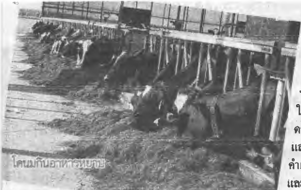
โคนมกินอาหารหยาง