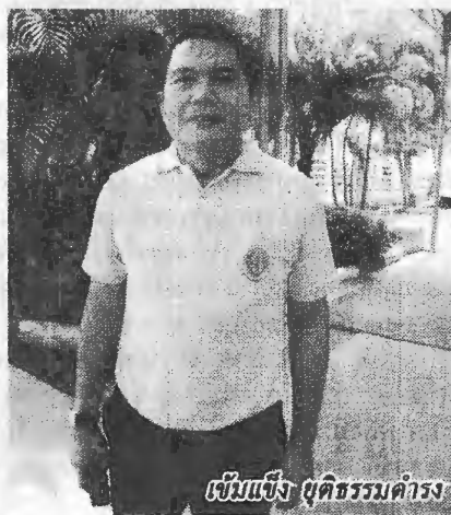
เข้มแข็ง ยุติธรรมดำรง

การใช้ประโยชน์พื้นที่ของเกษตรกรมีมาอย่างยาวนานตั้งแต่รุ่นปู่ย่าตายาย บ้างก็มีการใช้ปุ๋ยเคมี สารเคมีอย่างเต็มที่ บ้างก็ไม่ได้ใช้ตามคำแนะนำ