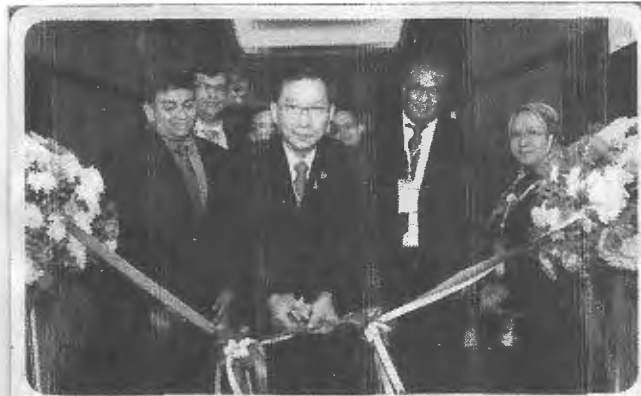
ทูน่าโลก-นิวดี สุทธิมีชัยกุล อธิบดีกรมประมง เป็นประธานเปิด การประชุมและนิทรรศการการค้าทูน่าโลก ครั้งที่ 13 จัดโดย กรม ประมง ร่วมกับ องค์การระหว่างประเทศด้านข้าว สารการตลาด และ บริการแนะนำด้านเทคนิคของสินค้าสัตว์น้ำแห่งเอเชียและแปซิฟิก ณ โรงแรมแชงกรี-ลา กรุงเทพฯ