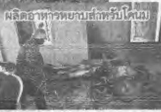
ผลิตอาหารหยางสำหรับโคนม