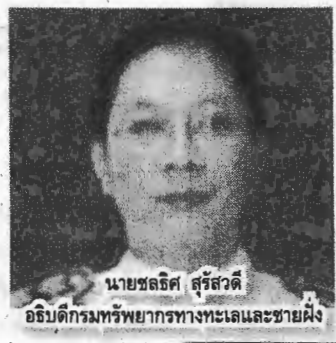
นายชวลิต สุรัสวดี อธิบดีกรมทรัพย์สินเกษตรทางทะเลและชายฝั่ง