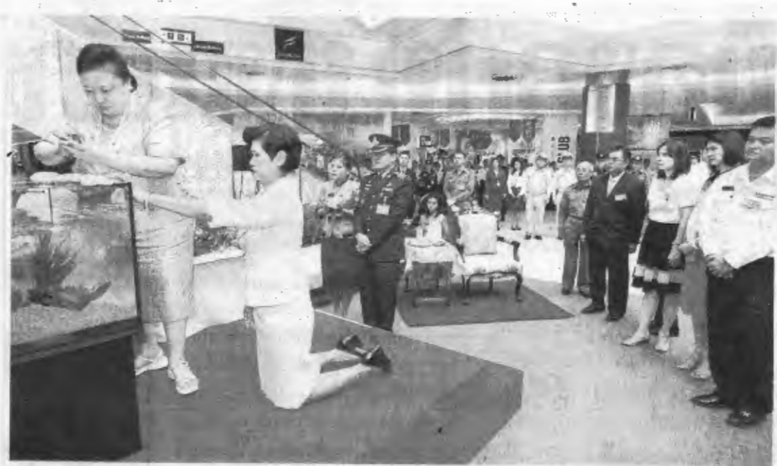
พระเจ้าวรวงศ์เธอ พระองค์เจ้าโสมสวลี พระวรราชทินนิตคามาทู เสด็จไปทรงจัดตู้ปลาที่พระหัตถ์ในงาน "วันประมงน้อมเกล้าฯ ครั้งที่ 26" ที่ศูนย์การค้าฟิวเจอร์พาร์ค