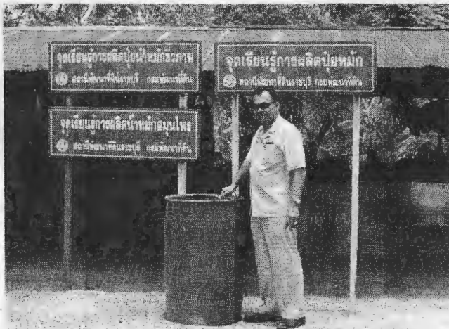
โค สถานีพัฒนาที่ดินราชบุรี ก็พยายามเข้าไปส่งเสริมทำความเข้าใจในเรื่องการปรับเปลี่ยนวิธีการผลิตให้หันมาพึ่งพาธรรมชาติมากขึ้น ไม่ว่าจะเป็นการปรับปรุงดินด้วยปุ๋ยพืชสด ปลูกพืช

ตระกูลถั่วแล้วไถกลบเพิ่มอินทรีย์วัตถุให้กับดิน ช่วยลดการใช้ปุ๋ยเคมีในฤดูการผลิตหน้า การทำปุ๋ยหมัก น้ำหมักชีวภาพจากวัสดุที่เหลือใช้ในไร่นาหรือในครัวเรือน การผลิตสารขับไล่แมลงจากพืชสมุนไพร เพื่อใช้ทดแทนหรือควบคู่กับเคมี พร้อมกันนั้นก็จัดทำแปลงสาธิตการพัฒนาที่ดินทุกรูปแบบกระจายอยู่ทั่วทั้งจังหวัด และสร้างเครือข่ายหมอดินอาสาประจำหมู่บ้านที่มีอยู่ประมาณ 940 คน ให้เป็นแกนหลักในการเข้าไปช่วยถ่ายทอดความรู้ สร้างความเข้าใจเพื่อนเกษตรกรในพื้นที่อย่างต่อเนื่อง