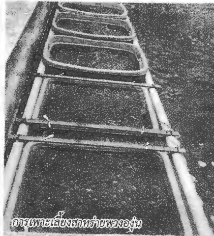
การเพาะเลี้ยงสาหร่ายพวงองุ่น

เส้นผม ทั้งยังมีงานวิจัยอีกหลายสถาบันที่เชื่อว่าสาหร่ายให้ผลเป็นยาในการต่อต้านและยับยั้งเซลล์ผิดปกติ หรือมะเร็ง ซึ่งสาหร่ายพวงองุ่นมีคุณสมบัติในการต้านเชื้อราด้วย