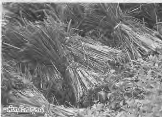
ต้นกล้าสมบูรณ์

ปัจจัยการผลิต ตามชนิดและราคาที่เหมาะสม การทำภายในประเทศต่ำกว่าราคาปกติระหว่าง 40-50 บาทต่อกระสอบหรือต่อชวด ซึ่งเกษตรกรสามารถซื้อหาปัจจัย