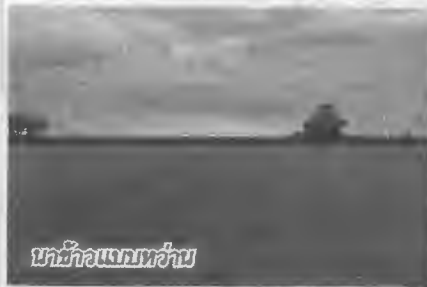
นาข้าวแบบหว่าน

ออกมามาก โดยจะมีสหกรณ์ 3 แห่ง ประกอบด้วยสหกรณ์การเกษตรท่าดี จำกัด สหกรณ์การเกษตรเมืองเลย จำกัด และสหกรณ์การเกษตร