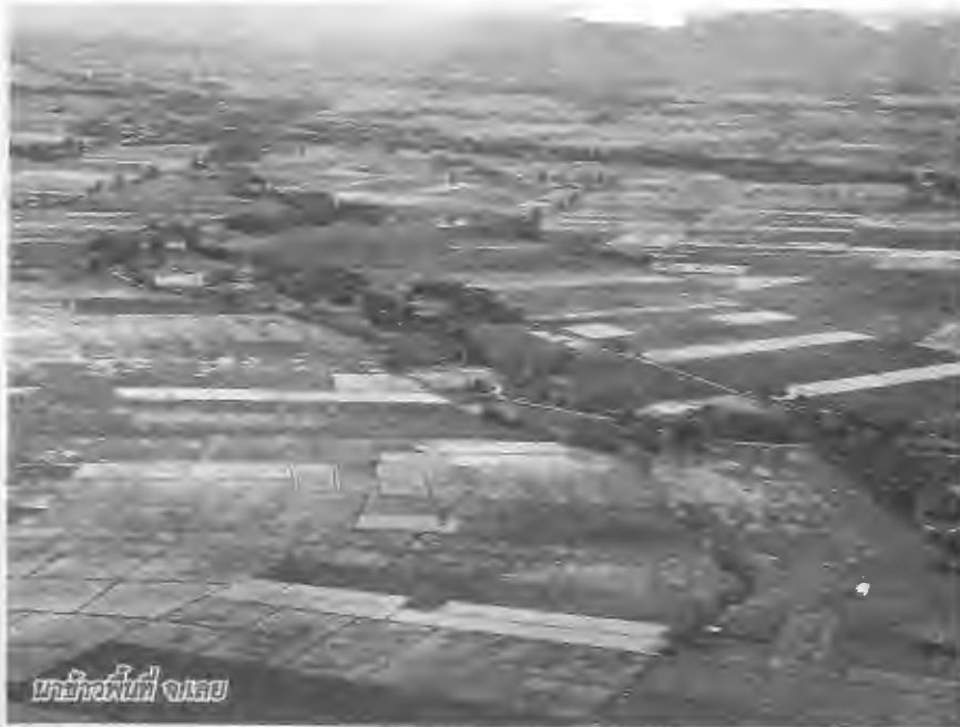
นาข้าวพื้นที่ จ.เลย