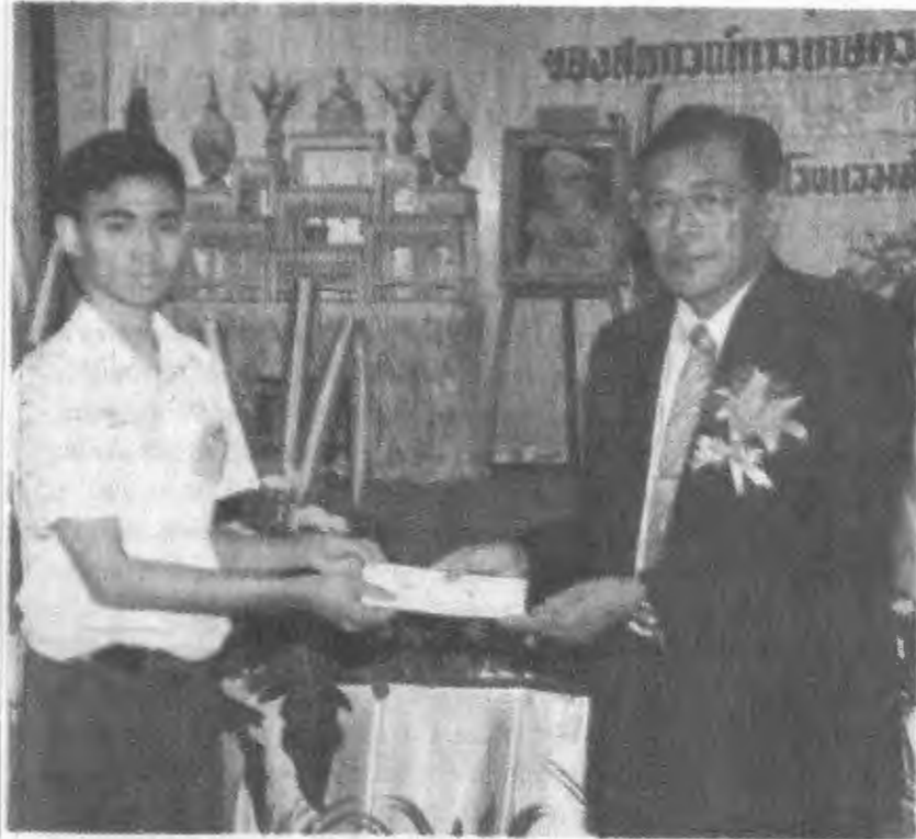
มอบทุนบุตรสมาชิก...ดร.จุมพล สงวนสิน อธิบดีกรมส่งเสริมสหกรณ์ เป็นประธาน เปิดการประชุมใหญ่สามัญประจำปีของสหกรณ์การเกษตรเมืองระยอง จำกัด พร้อมมอบ ทุนการศึกษาให้กับบุตรหลานสมาชิกสหกรณ์ ซึ่งสหกรณ์ได้จัดสรรเงินกำไรเพื่อเป็น สวัสดิการและทุนสาธารณประโยชน์ โดยมีสมาชิกสหกรณ์เข้าร่วมประชุมอย่างพร้อม เพรียง ณ โรงแรมสตาร์ระยอง อำเภอเมือง จังหวัดระยอง เมื่อเร็วๆ นี้