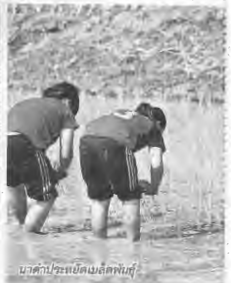
มาตรการแปะเมล็ดพันธุ์ดี

พฤศจิกายน 2557 เป็นต้นไป ซึ่งเกษตรกรผู้ปลูกข้าวและเป็นสมาชิกของสหกรณ์การเกษตรหรือกลุ่มเกษตรกร เมื่อไปขึ้นทะเบียนเกษตรกรผู้ปลูกข้าวกับสำนักงานเกษตรจังหวัดหรือเกษตรอำเภอแล้ว ให้ไปแจ้งสหกรณ์หรือกลุ่มเกษตรกรที่ตนเองสังกัด พร้อมหลักฐานการขึ้นทะเบียนเกษตรกร เพื่อสหกรณ์หรือกลุ่มเกษตรกรจะได้รวบรวมข้อมูลให้สำนักงานสหกรณ์จังหวัดเลยดำเนินการต่อ