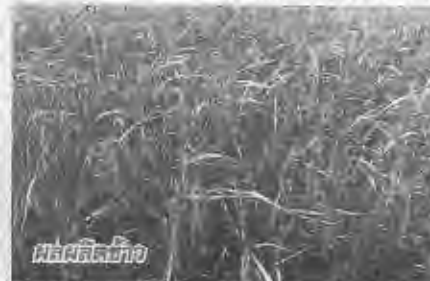
ผลผลิตข้าว

ปัจจัยการผลิต ตามชนิดและราคาที่เหมาะสม การทำภายในประเทศต่ำกว่าราคาปกติระหว่าง 40-50 บาทต่อกระสอบหรือต่อชวด ซึ่งเกษตรกรสามารถซื้อหาปัจจัย