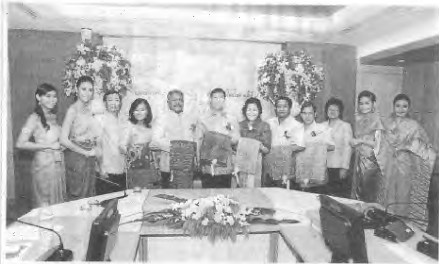
รักไหมไทย ชาวลิต ชูขจร ปลัดกระทรวงเกษตรและสหกรณ์ เป็นประธานแถลงข่าว เปิดงานตรามุกุญงพระราชทาน สืบสานตำนานไหมไทย ครั้งที่ 9 ประจำปี 2557 ภายใต้ แนวคิด "รักไหมไทย ใส่ใจรักษ์โลก" ระหว่างวันที่ 21-25 ส.ค. 2557 อิมแพค เมืองทองธานี