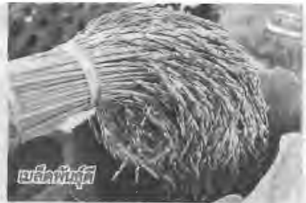
เมล็ดพันธุ์ดี

ไป คาดการณ์ว่าจังหวัดเลยจะมีสมาชิกสหกรณ์ หรือกลุ่มเกษตรกรผู้ปลูกข้าวในปี ปีการผลิต 2557/58 จำนวน 1,811 คน มูลค่าข้าวรวม 80.85 ล้านบาท มาตรการนี้จะช่วยเหลือเกษตรกรผู้ปลูกข้าวในปี ปีการผลิต 2557/58 ที่ได้ไปขึ้นทะเบียนเกษตรกรแล้วเท่านั้น