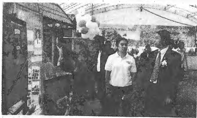
ชมผลงานเด่น-สุรพล จารุพงศ์ (ขวา) รองอธิบดีกรมส่งเสริม การเกษตร เยี่ยมชมผลงานกลุ่มวิสาหกิจชุมชนในพื้นที่ 6 จังหวัดภาคใต้ ตอนล่าง พร้อมให้กำลังใจเจ้าหน้าที่ปฏิบัติงานในการนำระบบ MRCF SYSTEM มาปรับใช้ในพื้นที่รับผิดชอบ ณ สำนักส่งเสริมและพัฒนากร เกษตรเขตที่ 5 จังหวัดสงขลา ถ.สงขลา-เกาะยอ ต.พะวง อ.เมือง จ.สงขลา เร็วๆ นี้