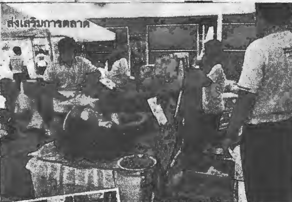
ส่งเสริมการตลาด

หวังเนื่องจากราคาผลผลิตค่อนข้างดี ยกเว้นลองกองในภาคใต้ตอนล่างที่อยู่ระหว่างการเฝ้าระวัง ซึ่งกรมส่งเสริมการเกษตรและหน่วยงานต่าง ๆ ที่เกี่ยวข้อง ได้หารือเพื่อจัดทำแผนการรับซื้อและกระจายผลผลิตลงมือออกจากรพื้นที่ไว้แล้ว