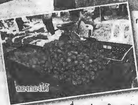
ลองกองใต้

ดังเช่นในช่วงเวลาขณะนี้ที่เป็นคิวของผลไม้จากภาคใต้กำลังทยอยหลังไหลเข้าสู่ตลาด ท่ามกลางการลุ้นระทึกของเกษตรกรชาวสวนในพื้นที่ว่า ปีนี้พวกเขาจะได้รับผลกระทบอีกหรือไม่