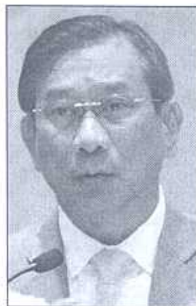
พล.อ.ฉัตรชัย สาริกัลยะ

ตรวจสอบสต็อกข้าวโพดเลี้ยงสัตว์ที่เก็บไว้ในโกดังต่างๆ ด้วย โดยกำลังติดตามข้าวโพดเลี้ยงสัตว์ที่เก็บไว้ในโกดัง จ.ตาก แต่ยังไม่สามารถขนของออกมาได้ โดยเจ้าของโกดังอ้างว่าได้ให้เช่าช่วง จึงไม่มีอำนาจในการเปิดโกดัง ซึ่งเมื่อ อคส.ได้ส่งเจ้าหน้าที่เข้าไปเพิ่ม ก็ถูกปิดล้อม ถึงขั้นมีการข่มขู่และพกปืนมาด้วย แต่เมื่อนำเจ้าหน้าที่ตำรวจเข้าไปช่วย จึงยอมเปิดทางให้เข้าไปตรวจ แต่ไม่สามารถขนข้าวโพดออกมาได้ เพราะไม่มีรายได้มาช่วยขนให้ เนื่องจากกลัวอิทธิพลเจ้าของโกดัง