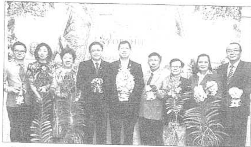
ครั้งที่ 8 : ขวาลิต สุขขร ปลัดกระทรวงเกษตรและสหกรณ์ และ ด็กชนา นะวีโรจน์ รอง ปธ.กก.มท.อาวุโส บงก.สยามพารากอน ริเทล ร่วมแถลงข่าว งาน "สยามพารากอน แวงก็อก รอยัล ออร์คิด พาราไดซ์" ที่กระทรวงเกษตร และสหกรณ์ เชิญชวนส่งกล้วยไม้เข้าประกวดในงาน ระหว่าง 26 พ.ย.-1 ธ.ค. 2557 ที่สยามพารากอน