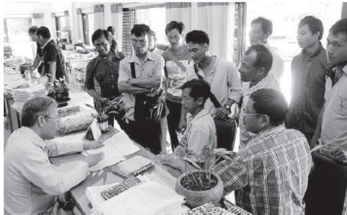
รอบ 2 - ชาวภา จ.เชียงราย ที่ยังไม่ได้ขึ้นทะเบียนปลูกข้าว และผู้ที่มีชื่อตกหล่นในการขึ้นทะเบียนรอบแรก พยายามขึ้นทะเบียนรอบ 2 เพื่อรับเงินช่วยเหลือตามโครงการไร่ละ 1,000 บาท ที่สำนักงานเกษตร อ.เมืองเชียงราย เมื่อวันที่ 3 พฤศจิกายน