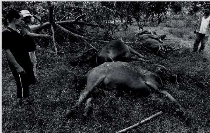
ตายยกฝูง - ชาวบ้าน ต.ดอนศิลา อ.เวียงชัย จ.เชียงราย เร่งนำซากกระบือกว่า 40 ตัวที่ตายล้มป่วยด้วยโรคคอบวมไปฝังกลบเพื่อป้องกันการแพร่เชื้อด้านปศุสัตว์จังหวัดประกาศเป็นเขตโรคระบาด ห้ามเคลื่อนย้ายสัตว์ พร้อมเร่งฉีดวัคซีนป้องกันให้สัตว์ที่เหลือ

ด้านเจ้าของกระบือที่ล้มตายกล่าวว่า กระบือทั้งหมดเลี้ยงจากพ่อพันธุ์และแม่พันธุ์จำนวน 11 ตัวตั้งแต่ปี 2528 ก่อขยายพันธุ์มาเรื่อยๆ จนล่าสุดมีกระบือทั้งหมด 53 ตัว โดยได้นำไปเลี้ยงบนเกาะมะพร้าวกลางหนองหลวง ซึ่งเป็นหนองน้ำสาธารณะติดกับหมู่บ้าน ต่อมากระบือมีอาการเชื่องซึมและจุกแหว่งผิดปกติ ก่อนที่วันรุ่งขึ้นจะพากันล้มตายอย่างกะทันหัน การสูญเสียในพื้นที่ทำให้เดือดร้อนหนักเพราะมูลค่าความเสียหายทั้งหมดประมาณ 3 ล้านบาท