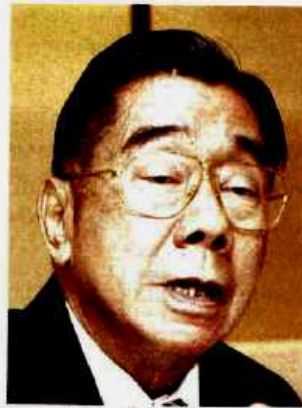
เปล่งศักดิ์ ประกาศเกลาฯ

ปริมาณการใช้ปุ๋ยเคมีในปีหน้าของไทยขึ้นอยู่กับสถานการณ์การเพาะปลูกพืช ปัจจุบันหลายพื้นที่ประสบปัญหาภัยแล้ง เกษตรกรขาดแคลนน้ำในการเพาะปลูก โดยเฉพาะเกษตรกรผู้ปลูกข้าวในเขตลุ่มน้ำเจ้าพระยา หน่วยงานราชการประกาศงดจ่ายน้ำสำหรับทำการเกษตร กระทบอย่างกับน้ำหลักมีน้ำน้อยกว่าช่วงเดียวกันที่ผ่านมา ซึ่งอาจส่งผลให้ผลผลิต