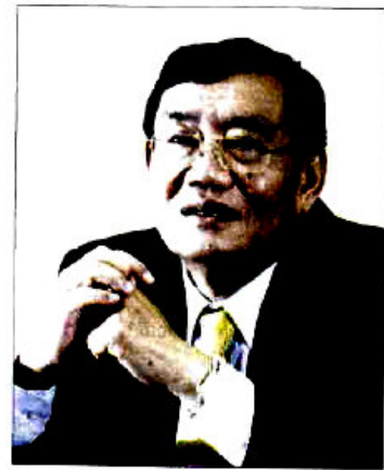
• ย่าบวย ปะติเส

นายกฯ คาดโทษ สั่งย้ายทุกฝ่าย เกียร์ว่าง งานไม่เดิน”