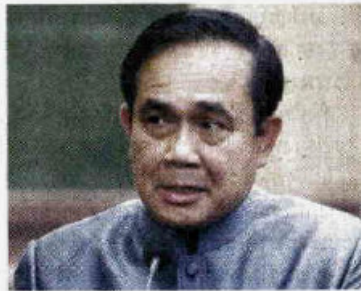
ประยุทธ์ จันทร์โอชา

"ประยุทธ์"เผยปิดบัญชี 15 โครงการ ขาดทุน อย่างน้อย 6.8 แสนล้าน