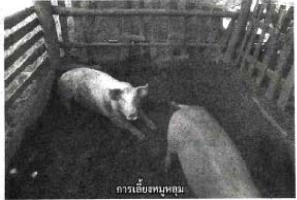
การเลี้ยงหมูหลุม