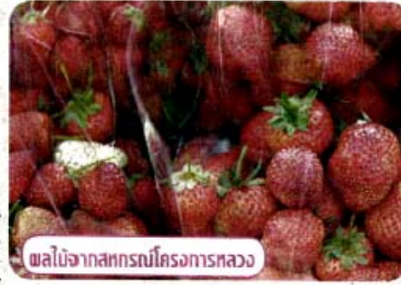
ผลไม้จากสหกรณ์โครงการหลวง

เพื่อยกระดับศูนย์กระจายสินค้าสหกรณ์ให้มี ระบบการบริหารงานที่มีประสิทธิภาพ สามารถ กระจายสินค้าสหกรณ์ไปยังตลาดทั้งในและต่าง ประเทศได้ เพื่อรองรับการเข้าสู่ประชาคม เศรษฐกิจอาเซียนในอนาคตอันใกล้