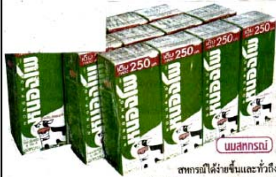
นมสหกรณ์

สหกรณ์ได้ย้ายขึ้นและทั่วถึง ซึ่งก่อให้เกิดประโยชน์ต่อสมาชิก สหกรณ์และช่วยสร้างภาพลักษณ์สินค้า สหกรณ์ต่อผู้บริโภคด้วย