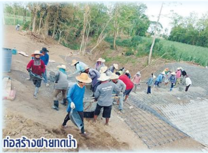
ก่อสร้างพายุทดน้ำ