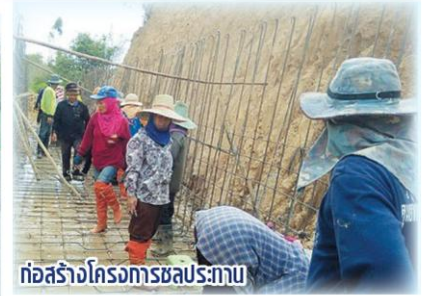
ก่อสร้างโครงการชลประทาน