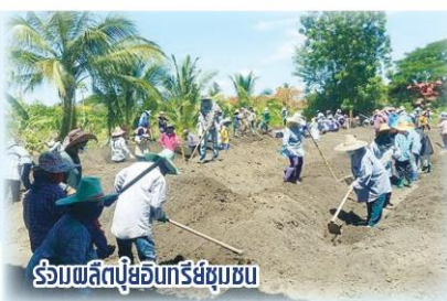
รับผลิตปุ๋ยอินทรีย์ชุมชน

นับเป็นการช่วยบรรเทาปัญหาภัยแล้งได้ในระยะยาว โดยมีศูนย์บริการและถ่ายทอดเทคโนโลยีการเกษตรประจำตำบล (ศบกด.) เป็นตัวแทนของชุมชนขอรับการสนับสนุนงบประมาณ และค่าจ้างแรงงานโดยเริ่มโครงการฯ ตั้งแต่เดือน ก.พ. และสิ้นสุดการดำเนินงานเดือน มิ.ย. 2558 และมีการบูรณาการภาครัฐ 3 หน่วยงานหลัก คือ กระทรวงมหาดไทย