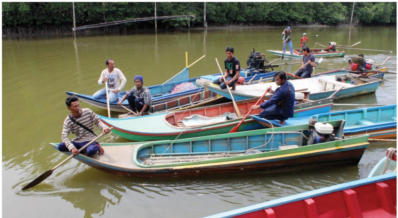
ประมงพื้นบ้านชุมพรอ่วม - เรือประมงพื้นบ้านขนาดเล็กในจังหวัดชุมพรที่นั่งได้ 1-2 คน และแผ่นโฟมขนาดใหญ่ที่ชาวบ้านใช้ออกไปจับกุ้ง หอย ปู ปลาตามชายฝั่ง ซึ่งชาวบ้านระบุว่ายังถูกเจ้าหน้าที่จับกุมจากการบังคับใช้มาตรา 44

ด้านนายธำรง พันธุ์เล็ก อดีตนายกสมาคมประมงร่วมใจปากน้ำชุมพร กล่าวว่า ชาวประมงไม่สามารถยอมรับมาตรา 44