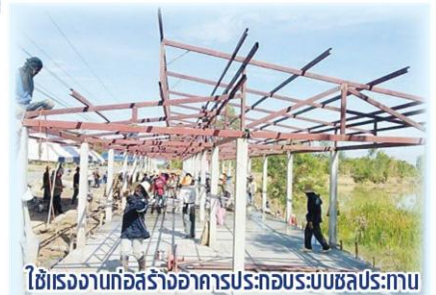
ใช้แรงงานก่อสร้างอาคารประกอบระบบชลประทาน

ได้รับมีจำนวนเกษตรกรผู้ใช้แรงงาน 931,514 ราย ได้แรงงาน 4,510,751 แรง และมีจำนวนครัวเรือนเกษตรกรที่ได้รับประโยชน์ 2,753,383 ครัวเรือน ที่สำคัญการดำเนินโครงการนี้ ก่อให้เกิดผลจากการดำเนินกิจกรรมที่สำคัญ คือ การจัดการแหล่งน้ำเพื่อการเกษตร สามารถช่วยรองรับพื้นที่การเกษตรได้ทั้งหมด 5,279,538 ไร่ กิจกรรมการผลิตทางการเกษตรและแปรรูปผลผลิตเกษตรเพื่อ