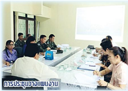
การประชุมวางแผนงาน