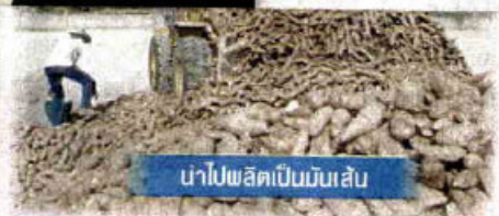
ป่าไปผลิตเป็นมันเส้น

มีการทำข้อตกลงซื้อขายมันเส้น เพื่อนำไปเป็น วัตถุดิบในการผลิตอาหารสัตว์กับสหกรณ์ผู้เลี้ยง โคนมในจังหวัดสระบุรี