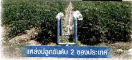
แหล่งปลูกอันดับ 2 ของประเทศ

คลัสเตอร์ข้าว ยางพารา ผลไม้ ปาล์มน้ำมัน นม และมันสำปะหลัง ดังตัวอย่างความสำเร็จจาก การรวมกลุ่มกันของสหกรณ์ผู้ผลิตมันเส้น สะอาด คุณภาพดีในจังหวัดกำแพงเพชร ซึ่งได้