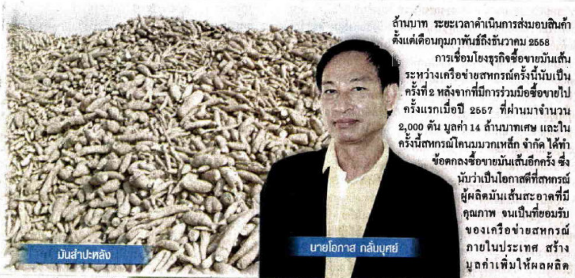
มันสำปะหลัง