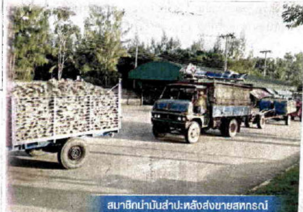
สมาชิกนำมันสำปะหลังส่งขายสหกรณ์

สหกรณ์ได้มีการสนับสนุนการดำเนินงานของ สหกรณ์ในการทำหน้าที่เป็นผู้ผลิตและ จำหน่ายผลผลิตทางการเกษตรที่มีคุณภาพ ควบคู่ไปกับการขับเคลื่อนนโยบาย “เครือ ข่ายเข้มแข็ง สหกรณ์เข้มแข็ง” ในรูปแบบ ของการเชื่อมโยงเครือข่ายสหกรณ์ ตลอดจน มูลค่าของห่วงโซ่การผลิต โดยใช้ผลผลิต หลักของสหกรณ์หนึ่งส่งไปเป็นวัตถุดิบของ อีกสหกรณ์หนึ่ง ก่อนจะแปรรูปเป็นผลิต ภัณฑ์เพื่อเพิ่มมูลค่า ส่งผลให้การดำเนินธุรกิจ