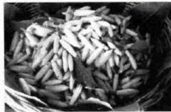
ให้คงอยู่ต่อไป

ปัจจุบันสมาชิกส่วนหนึ่งของ สหกรณ์ ยังคงประกอบอาชีพทำสวน กล้วยไม้ และตัดดอกส่งขายให้กับแม่ค้าที่ ปากคลองตลาด โดยสหกรณ์มีส่วนช่วย สนับสนุนในเรื่องการจัดหาปัจจัยการผลิต และเป็นแหล่งเงินทุนในการประกอบอาชีพ