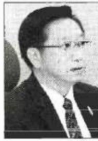
คณิต ลิขิตวิทย์ วุฒิ

นายคณิต ลิขิตวิทย์ วุฒิ รองเลขาธิการ สำนักงานเศรษฐกิจการเกษตร (สศก.) ในฐานะประธานคณะกรรมการประชาสัมพันธ์ผลการดำเนินการของคณะกรรมการนโยบายปาล์มน้ำมันแห่งชาติ (กนป.) เปิดเผยว่า ตั้งแต่วันที่ 1 สิงหาคม นี้เป็นต้นไป สำนักงานคณะกรรมการว่าด้วยราคาสินค้าและบริการ (สกก.) ซึ่งอยู่ในความรับผิดชอบของกระทรวงพาณิชย์ จะออกประกาศให้โรงงานสกัดน้ำมันหรือลานเทรับซื้อผลปาล์มทะเลทรายและผลปาล์มร่วงจากเกษตรกรในราคาเดียว อัตราน้ำมันไม่ต่ำกว่าร้อยละ 17 ไม่ต่ำกว่ากิโลกรัมละ 4.20 บาท และถ้าผลปาล์มทะเลทรายที่นำมาขายมีเปอร์เซ็นต์น้ำมันสูงกว่าร้อยละ 17 ทุก 1% ที่เพิ่มขึ้น จะได้ราคาเพิ่มขึ้นอีกกิโลกรัมละ 0.30 บาท ในขณะที่หากเกษตรกรนำปาล์มที่ไม่มีคุณภาพหรือมีเปอร์เซ็นต์ต่ำกว่า 17% ทางโรงสกัดน้ำมันหรือลานเทอาจปฏิเสธการรับซื้อได้ ดังนั้น เกษตรกรต้องดูแลสวนปาล์ม และคัดผลปาล์มที่สุกโดยสังเกตจากทะเลทรายที่