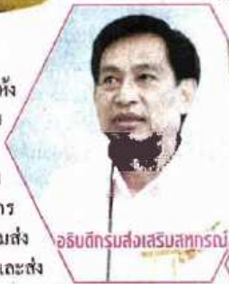
อรรถดิทรนส่งเสริมสหกรณ์

“ขณะนี้เป็นการทำข้อตกลงเบื้องต้น ยังไม่ได้ดำเนินการเรื่องจัดทำสัญญา เข้าใจว่าจะได้คุยเพื่อจะทำ