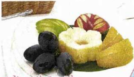
ผลไม้สหกรณ์ขึ้นครุภัณฑ์ไทย

จาก 19 จังหวัดที่ทำการผลิตผลไม้ทั้งสดและแปรรูป ซึ่งทางกรมฯ จะคัดเลือกสหกรณ์ที่มีศักยภาพและมีความสามารถในการผลิตผักและผลไม้ที่มีคุณภาพตรงตามที่ทางกระทรวงคมนาคม หรือบริษัท การบินไทย จำกัด (มหาชน) ต้องการ จึงจะสามารถเข้าร่วมโครงการนี้ได้