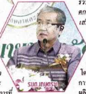
สุน เกษตรฯ

จะส่งมอบสินค้าเหล่านั้น คงจะต้องทำไปตามฤดูกาลของผลผลิต ว่าช่วงไหนมีผลผลิตอะไรบ้าง อย่างทางภาคเหนือจะไปเน้นเรื่องของลำไยอบแห้ง ลำไยสีทอง จากจังหวัดเชียงใหม่ ลำพูน ในภาคตะวันออกก็จะเน้นผลไม้ตามฤดูกาล โดยเฉพาะในช่วงพฤษภาคม มิถุนายน กรกฎาคม คาดว่าจะช่วยส่งเสริมให้ราคา ผัก ผัก ผลไม้ สามารถยกระดับสูงขึ้น ซึ่งสมาชิกสหกรณ์ หรือสถาบันเกษตรกร ก็จะมีรายได้จากโครงการนี้มากขึ้น แต่อย่างไรก็ตามสมาชิกสหกรณ์เองก็ต้องปรับปรุงคุณภาพให้ได้มาตรฐานที่ต้องการ ต้องประณีต มีความพิถีพิถันในการเพาะปลูกผักผลไม้เหล่านั้น