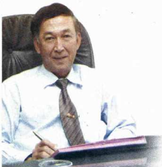
อรชูล วัฒนยานันท์ อธิบดีกรมฝนหลวงและการนิเวศ

1. สาเหตุของสถานการณ์ภัยแล้งที่เกิดขึ้นในปัจจุบัน นายอรชูล วัฒนยานันท์ อธิบดีกรมฝนหลวงและการนิเวศฯ ได้วิเคราะห์สาเหตุของสถานการณ์ภัยแล้งในปัจจุบันว่าเกิดจากอิทธิพลของปรากฏการณ์เอลนีโญที่เริ่มส่งผลกระทบต่อสภาวะอากาศของประเทศต่างๆ ในภูมิภาคอาเซียน รวมทั้งประเทศไทย มาตั้งแต่ปลายปี 2557 ทำให้ปริมาณน้ำฝนในภาพรวมของประเทศต่ำกว่าค่าปกติค่อนข้างมาก โดยเฉพาะในช่วงเริ่มต้นของฤดูฝนตั้งแต่กลางเดือนพฤษภาคม 2558 เป็นต้นมา ซึ่งโดยปกติ