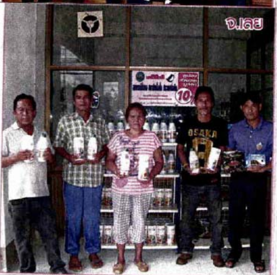
ศึกษาคัด...นายโอภาส ก้านบุศย์ อธิบดีกรมส่งเสริมสหกรณ์ กระทรวงเกษตรฯ ไปร่วมพิธีเปิดที่ทำการส่งเสริมสหกรณ์ทำนบกักน้ำจืด จ.พัทลุง มีชาวบ้านมาใช้คู่มือส่งเสริมการขายแลกเปลี่ยนสินค้าศึกษาคัด ส่วนที่สหกรณ์แม่จัน จ.เชียงราย-สหกรณ์เมืองงาย-สหกรณ์เลย บรรยายภาคศึกษาคัดเช่นกัน