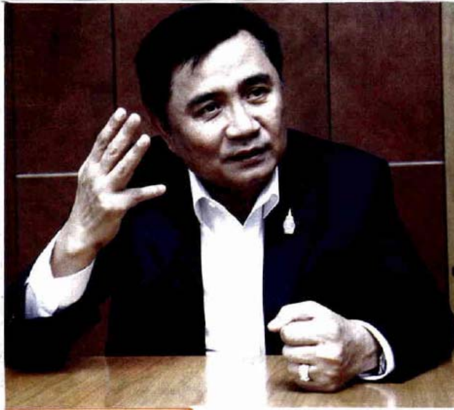
สัมภาษณ์