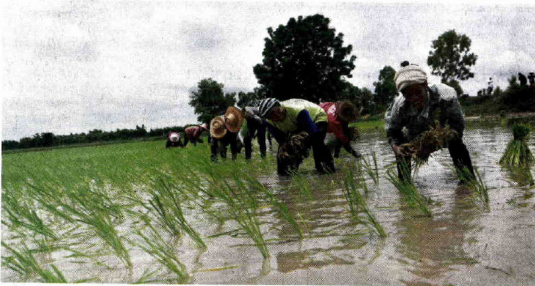
ดำนา : ชาวนาหมู่บ้านดงหมอง หมู่ 4 ต.หินกอง อ.สุวรรณภูมิ จ.ร้อยเอ็ด ช่วยกันลงแขกดำนา หลังฝนได้เริ่มตกลงมา ทำให้มีน้ำเพียงพอสำหรับการทำนา