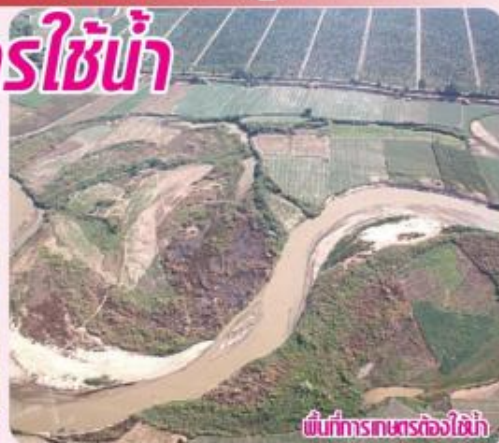
พื้นที่การเกษตรต้องใช้น้ำ

จนกระทั่งสินค้าถูกแปรรูปไปถึงมือผู้บริโภคแล้วแต่ละสินค้าหรือผลิตภัณฑ์กัน ๆ มีการใช้เกิดตลอดกระบวนการผลิตปริมาณมากน้อยเพียงใด ซึ่งสินค้าที่มี