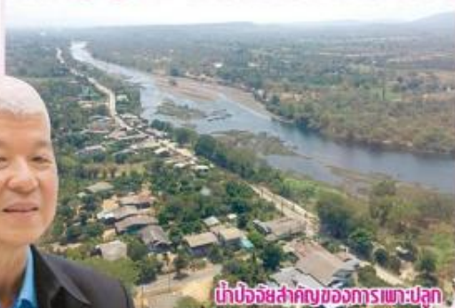
น้ำปัจจัยสำคัญของการเพาะปลูก