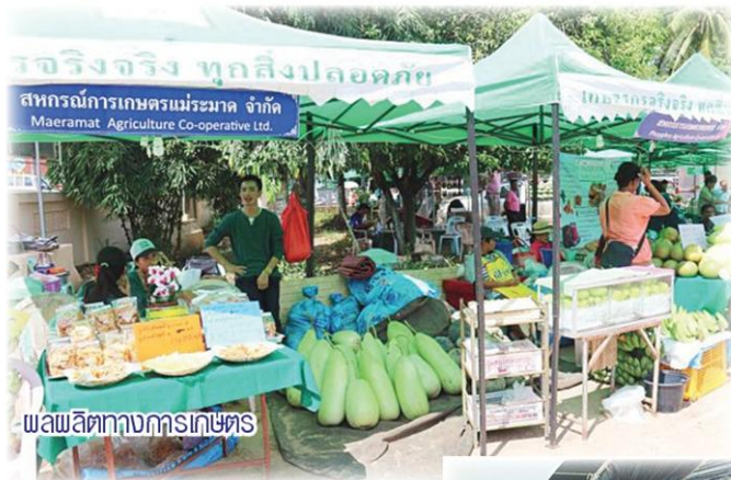
ผลผลิตทางกรเกษตร

สิ่งที่สำคัญ คือ จะต้องส่งเสริมให้เกษตรกรทำเกษตรอินทรีย์ เพื่อลดต้นทุนการผลิตอย่างยั่งยืน โดยกระทรวงเกษตรฯ จะสนับสนุนการวิจัยและจัดโซนนิ่งให้เหมาะสมกับการเพาะปลูก และดูแลเกษตรกรให้มีรายได้ที่เหมาะสม