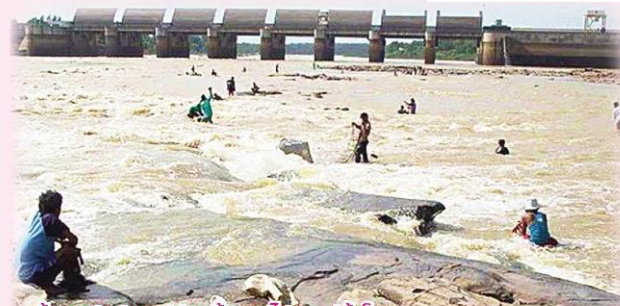
น้ำมาเปิดประตูปล่อยน้ำออกไปลงแม่น้ำโขง