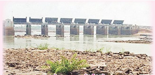
เปิดประตูทุกบานปล่อยน้ำออกท่วมคันดินจึงไม่มีขี้โคลน

สภาพทั่วไปของพื้นที่ริมแม่น้ำมูล มี 8 อำเภอ ได้แก่ อำเภอเมืองวารินชำราบสว่างวีระวงศ์ พิบูลมังสาหาร ดอนมดแดง ตาลชุมสิรินธร และโขงเจียม ซึ่งที่ผ่านมาได้รับผลกระทบจากการเปิดประตูระบายน้ำเขื่อนปากมูล ส่งผลให้ดินริมแม่น้ำมูลพังเสียหายในหลายพื้นที่ ระบบนิเวศในแม่น้ำมูลและลำห้วยสาขาเสียหาย