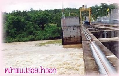
หน้าฝนปล่อยน้ำออก

สภาพทั่วไปของพื้นที่ริมแม่น้ำมูล มี 8 อำเภอ ได้แก่ อำเภอเมืองวารินชำราบสว่างวีระวงศ์ พิบูลมังสาหาร ดอนมดแดง ตาลชุมสิรินธร และโขงเจียม ซึ่งที่ผ่านมาได้รับผลกระทบจากการเปิดประตูระบายน้ำเขื่อนปากมูล ส่งผลให้ดินริมแม่น้ำมูลพังเสียหายในหลายพื้นที่ ระบบนิเวศในแม่น้ำมูลและลำห้วยสาขาเสียหาย