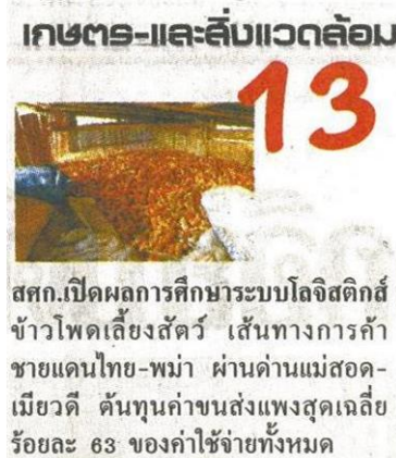
สศก.เปิดผลการศึกษาระบบโลจิสติกส์ข้าวโพดเลี้ยงสัตว์ เส้นทางการค้าชายแดนไทย-พม่า ผ่านด่านแม่สอด-เมียวดี ต้นทุนค่าขนส่งแพงสุดเฉลี่ยร้อยละ 63 ของค่าใช้จ่ายทั้งหมด