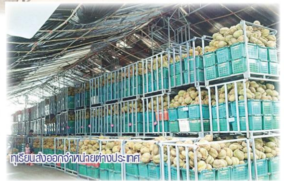
กรีเยนส่งออกจำหน่ายต่างประเทศ

“ความร่วมมือระหว่าง 2 หน่วยงาน นับเป็นการกิจที่สำคัญในการประสานความร่วมมือเพื่อนำไปสู่การพัฒนาคุณภาพด้านการเกษตรของประเทศ ซึ่งกองทุนฟื้นฟูและพัฒนาเกษตรกรมีเกษตรกรสมาชิกที่อยู่ในความดูแลประมาณ 5.7 ล้านคน ที่กำลังรอคอยการช่วยเหลือ สนับสนุนส่งเสริมความรู้จากภาครัฐ โดยสอดคล้องกับนโยบายของรัฐบาลที่ต้องการยกระดับคุณภาพ