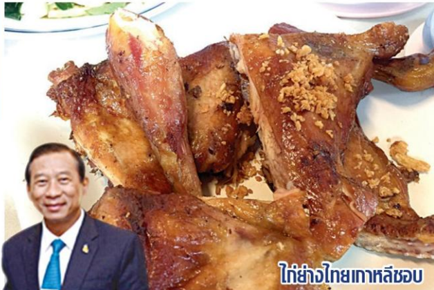
ไก่อ่างไทยเกาหลีชอบ

สำหรับสินค้าเกษตรที่ภาคเอกชน เกาหลีมีความสนใจที่จะนำเข้าจากไทยเพิ่มขึ้น