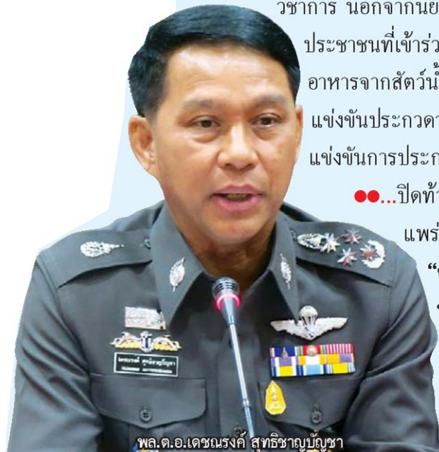
พล.ต.อ.เดชณรงค์ สุทธิชาญบัญชา

แพร่ผ่านเว็บไซต์มูลนิธิโพธิธรรพ์ “ความรัก ที่ต่ำช้าของร่างกาย นั้นมันมีปีก และจะบินหนีไป เมื่อความเป็นหนุ่มเป็นสาว นั้นสิ้นสุดลง รักชนิดนี้เป็น เท่ห์ของตัณหา”