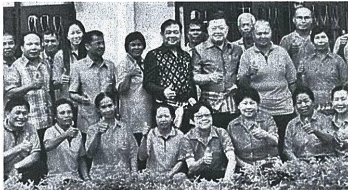
เร่งรัดงานสหกรณ์ ดร.วิณะโรจน์ ทรัพย์ส่งสุขอธิบดีกรมส่งเสริมสหกรณ์ ตรวจสอบเครดิตบูโรยื่นหนองนงเกษียน จำกัด พร้อมแนะนำส่งเสริม น้อมนำหลักการเศรษฐกิจพอเพียงตามนโยบายเร่งด่วนของ รมว.เกษตรฯ ณ สำนักงานสหกรณ์เครดิตบูโรยื่นหนองนงเกษียน จำกัด อ.น้ำพอง จ.ขอนแก่น.