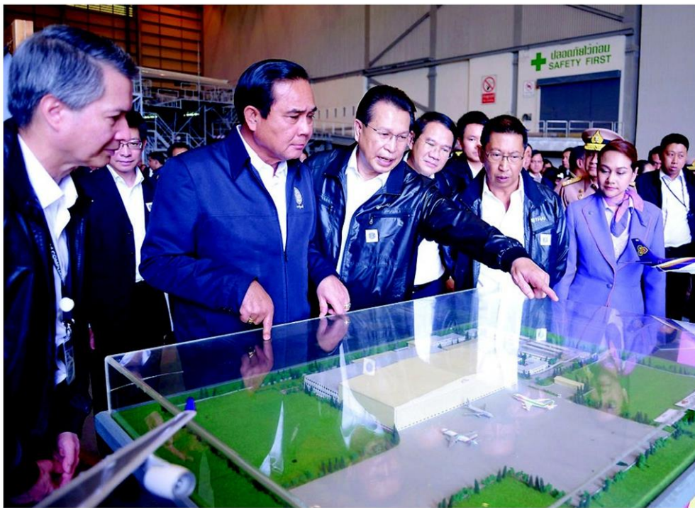
คืบหน้า - พล.อ.ประยุทธ์ จันทร์โอชา นายกรัฐมนตรี และคณะ เยี่ยมชมอาคารผู้โดยสารหลังใหม่ของท่าอากาศยานนานาชาติอุตะเภา ในการติดตามความก้าวหน้าการพัฒนาท่าอากาศยานอุตะเภาให้เป็นที่ท่าอากาศยานพาณิชย์แห่งที่ 3 อ.บ้านฉาง จ.ระยอง เมื่อวันที่ 22 มิถุนายน

นางอรรชกา กล่าวว่า กระทรวงอุตสาหกรรมให้ความสำคัญในการส่งเสริมการลงทุนในพื้นที่เขตเศรษฐกิจพิเศษภาคตะวันออก ให้เป็นเขตเศรษฐกิจชั้นนำของอาเซียน เตรียมร่างกฎหมายสนับสนุนการลงทุน พร้อมจะพัฒนาต่อยอดความร่วมมือด้านอุตสาหกรรมและบริการในอนาคต เพื่อให้ นักลงทุนทั่วโลกรู้จักด้วยอุตสาหกรรมยานยนต์ อิเล็กทรอนิกส์ และปิโตรเคมี ในระยะเวลาอันใกล้ในพื้นที่ภาคตะวันออก มีเอกชน