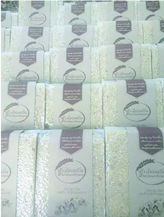
ข้าวซ้อมครั้น ของ ป.ธ.แก้หนึ่งเกษตรกร