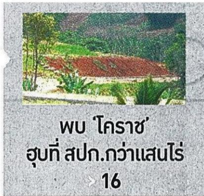
พว 'โคราช' ฮุบที่ สปก.กว่าแสนไร่ > 16

'ฉัตรชัย' ประเดิมติดประกาศทางคืนชัยภูมิ 15 ก.ค.นี้