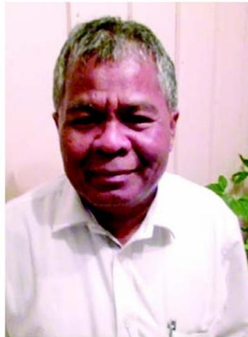
ละม้าย เสนขวัญแก้ว

กองทุนฯ ประสบปัญหาการฟื้นฟูและพัฒนาเกษตรกรให้มีอาชีพ เพราะว่าเขามีภาระหนี้สินรัฐบาลจึงแก้ไขเพิ่มเติมเป็นพระราชบัญญัติปี 2544 ให้ไปดูแลจัดการหนี้เกษตรกรด้วย