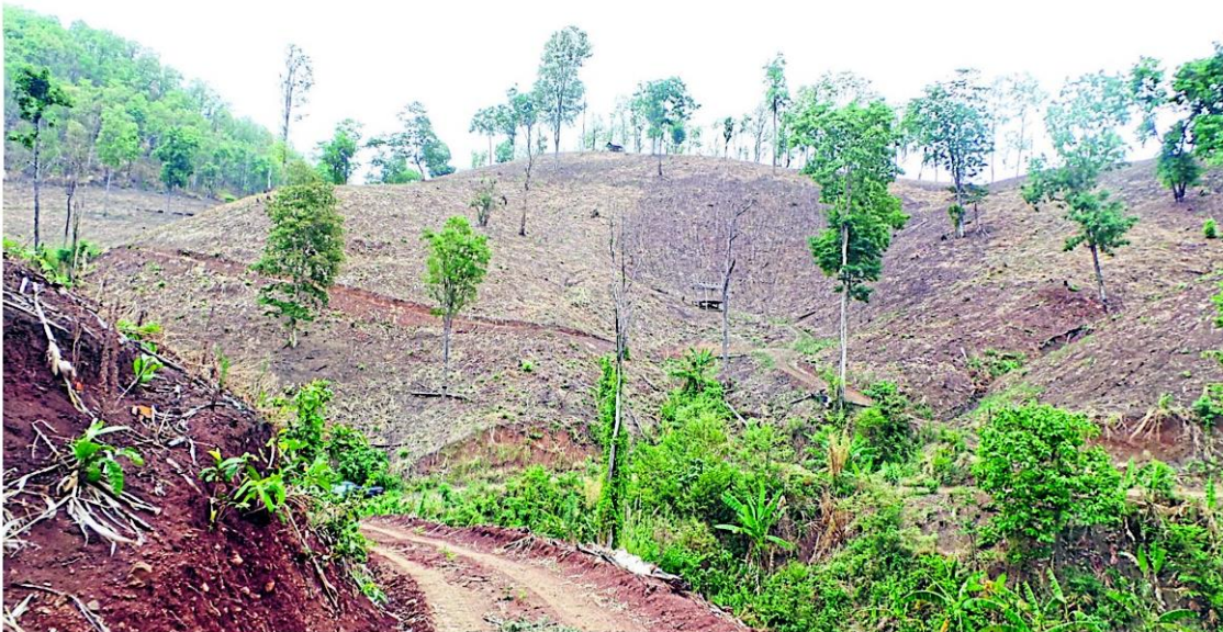
■ ทิวเขาน่านภูมิกภาคโพสต์ทูเดย์

จากเมืองเล็กๆ ที่มีศักยภาพด้านการท่องเที่ยว ชีวิตความเป็นอยู่แบบสโลว์ไลฟ์ที่ใครๆ ก็ฝันหา เมืองต้องห้ามพลาด ถูกบรรจุอยู่ในปฏิทินการท่องเที่ยวลำดับต้นๆ ของไทย แต่ทุกวันนี้ภูเขาที่