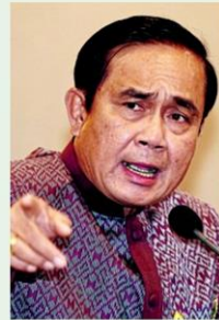
พล.อ.ประยุทธ์

ขณะที่พื้นที่ 71.59 ล้านไร่ แม้ว่าจะเป็นพื้นที่ของเกษตรกรเอง แต่ในจำนวนนี้มีพื้นที่ 29.72 ล้านไร่ ติดภาระจำนอง และอีก 1.15 แสนไร่อยู่ในกระบวนการขายฝาก ซึ่งมีความเสี่ยงว่าที่ดินจะหลุดมือไปเป็นของเจ้าหนี้ระบบหรือสถาบันการเงิน