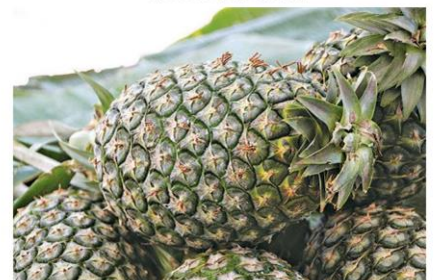
ผลผลิตสมบูรณ์

ทั้งนี้ พ่อค้าผู้รวบรวมผลผลิตและพ่อค้าต่างถิ่น จะขายต่อให้กับพ่อค้าปลีกและนำออกสู่ตลาดเพื่อจำหน่ายแก่ผู้บริโภค เพื่อบริโภคผลสด คิดเป็นร้อยละ 78 และตัวแทนบริษัทนำไปขายต่อให้โรงงานแปรรูป เพื่อจำหน่ายแก่ผู้บริโภคในรูปผลิตภัณฑ์แปรรูปคิดเป็นร้อยละ 22