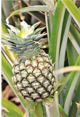
วันนี้อากาศดี