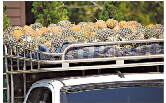
สับปะรดส่งตลาด

ด้านการตลาด พบว่า เกษตรกรส่วนใหญ่จะขายให้พ่อค้าผู้รวบรวมผลผลิต ร้อยละ 54 รองลงมาคือ ตัวแทนบริษัทหรือโรงงาน ร้อยละ 22 พ่อค้าต่างถิ่น ร้อยละ 20 และเกษตรกรเก็บไว้ขายเองที่ตลาด ร้อยละ 4