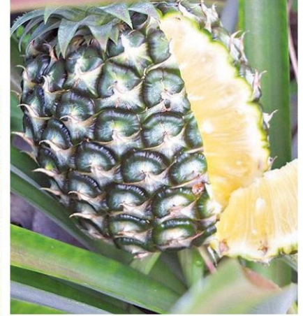
เนื้อดีตรงความต้องการของตลาด