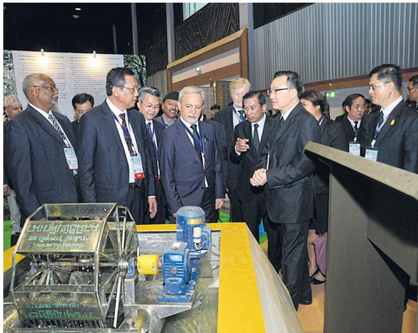
ชลประทานโลก : พล.อ.ฉัตรชัย สาริกัลยะ รัฐมนตรีว่าการกระทรวงเกษตรและสหกรณ์ เปิดการประชุมชลประทานโลก ครั้งที่ 2 และการประชุมมนตรีฝ่ายบริหารระหว่างประเทศ ครั้งที่ 67 ภายใต้หัวข้อ "การบริหารจัดการน้ำภายใต้สภาวะการเปลี่ยนแปลงของโลก: บทบาทการชลประทานต่อความยั่งยืนด้านอาหาร" ณ ศูนย์ประชุมและแสดงสินค้านานาชาติเฉลิมพระเกียรติ 7 รอบพระชนมพรรษา จ.เชียงใหม่ เมื่อ 6 พ.ย. 2559