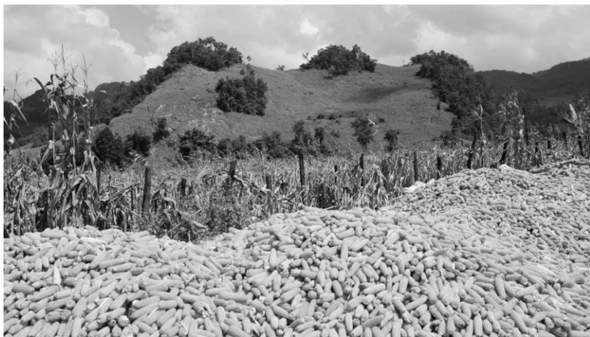
ไม่มีที่ขาย - ข้าวโพดเลี้ยงสัตว์จะออกสู่ตลาดมากในช่วงปลายปี แต่เกษตรกรไม่มีที่ขาย เพราะพ่อค้าคนกลางหยุดรับซื้อ ส่วนราคาตกต่ำอยู่ที่ 3.50 บาท/กก.

นายสถิตย์ ยะแก้ว หัวหน้ากลุ่มส่งเสริมและพัฒนาการผลิต สำนักงานเกษตร จ.เพชรบูรณ์ กล่าวว่า เพชรบูรณ์เหมาะสมในการปลูกข้าวโพดมาก มีพื้นที่ปลูก 774,266 ไร่ ผลผลิตเฉลี่ย 820 กก./ไร่ ต้นทุนเฉลี่ยไร่ละ 4,270 บาท ปีนี้คาดว่าผลผลิตทั้งหมด 634,898 ตัน ขณะที่ราคาขายปัจจุบัน 5.30 บาท/กก. ทั้งนี้ ข้าวโพดเลี้ยงสัตว์