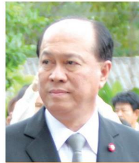
• พล.อ.อนุพงษ์ เผ่าจินดา

ผลผลิตข้าวเปลือกทุกประเภทในปีนี้จะเพิ่มจากปีก่อน 1 ล้านตัน แต่กรมการข้าว รายงานว่าเฉพาะข้าวเปลือกหอมมะลิชนิดเดียวจะเพิ่ม 3 ล้านตัน ทำไม 2 หน่วยงานภายใต้กระทรวงเกษตรและสหกรณ์ที่มี พล.อ.ฉัตรชัย สาริกัลยะ เป็นรัฐมนตรีไม่ได้ทำงานร่วมกันหรือไง แล้วรัฐมนตรีเกษตรฯขงตัวเลขไหนให้รัฐบาลตัดสินใจ.....*◆*.....งานบ้านและสวนแฟร์ 2016 ตั้งแต่วันที่ 29 ตุลาคม - 6 พฤศจิกายน 2559 ที่อิมแพ็ค เมืองทองธานี ปีนี้ขอนำแนวพระราชดำริปรัชญาเศรษฐกิจพอ