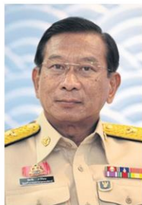
พล.อ.ฉัตรชัย

อย่างไรก็ตาม ที่ประชุมคณะกรรมการนโยบายและบริหารจัดการข้าว (นบข.) เมื่อวันที่ 18 พ.ย. ได้เห็นชอบให้ยกเลิก