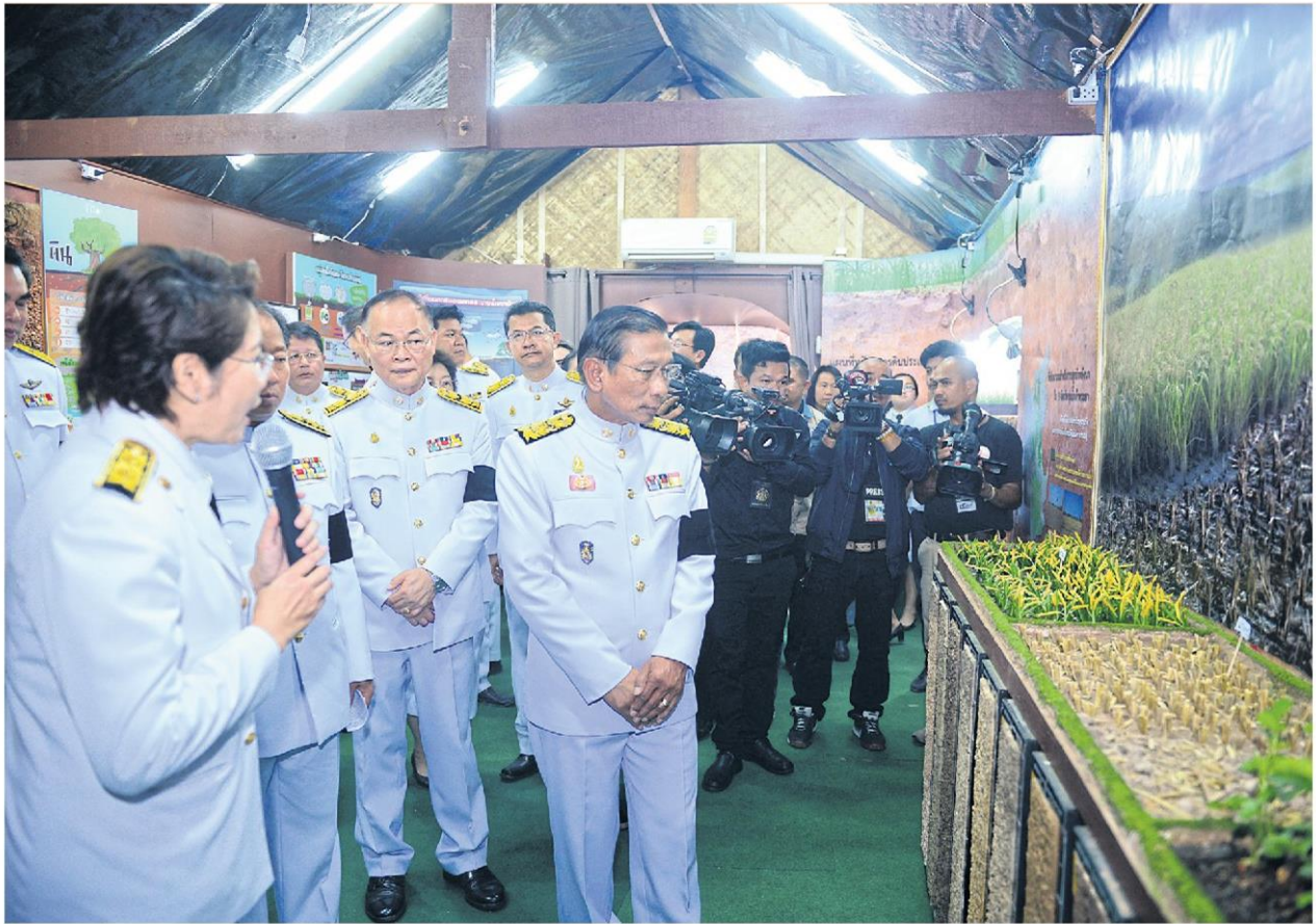
วันดินโลก : พล.อ.ฉัตรชัย สาริกัลยะ รมว.เกษตรและสหกรณ์ เป็นประธานในพิธีน้อมรำลึกพระมหากษัตริย์องค์ก่อนพร้อม เทิดพระเกียรติ พระบาทสมเด็จพระปรมินทรมหาภูมิพลอดุลยเดช เนื่องในวันดินโลก 5 ธ.ค. ณ ศูนย์ศึกษาการพัฒนา เขาดินชื่อน อันเนื่องมาจากพระราชดำริ อ.พนมสารคาม จ.ฉะเชิงเทรา