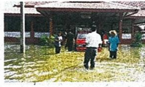
เล็งชุดคลอง-สร้าง7อ่าง แก้ระยะยาวน้ำท่วม'ได้'