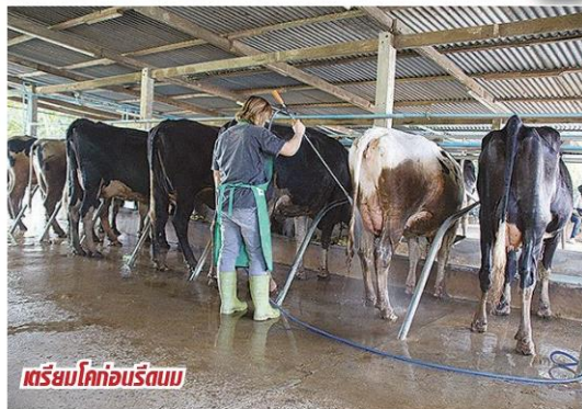
เตรียมโคก่อน擠นม

พื้นฐานในการดำรงชีวิต ที่จะนำไปสู่ความสุขในการดำเนินชีวิตอย่างแท้จริง ประเทศไทยเป็นประเทศเกษตรกรรม เศรษฐกิจของประเทศจึงอยู่ที่เศรษฐกิจการ