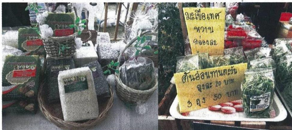
ผลผลิตเกษตรอินทรีย์ของยโสธร - ผลิตภัณฑ์แปรรูปเกษตรอินทรีย์

ด้าน นางอภิรดี ดันตรารมณ์ รัฐมนตรีว่าการกระทรวงพาณิชย์ กล่าวระหว่างเป็นประธานเปิดงาน "เกษตรอินทรีย์ยโสธร 2559" ว่ายุทธศาสตร์