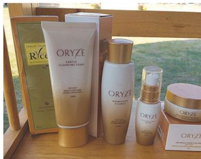
ผลิตภัณฑ์ประทิ่นไหมจากข้าว

โดยมีวัตถุประสงค์เพื่อรณรงค์และประชาสัมพันธ์ให้คนไทยรู้จักข้าวไทยหลากหลายชนิดพันธุ์ที่มีโภชนาการโดดเด่น และเลือกบริโภคข้าวเป็นโภชนาบำบัดสอดคล้องกับความต้องการ ด้วยจุดแข็งของข้าวไทยที่มีความหลากหลายทางชีวภาพ ทำให้มีพันธุ์ข้าวที่หลากหลาย สามารถคัดเลือกพันธุ์และปรับปรุงพันธุ์ข้าวได้อย่างยืดหยุ่นกับสถานการณ์เพาะปลูกข้าว