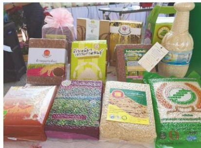
มาหลากหลายให้เลือกตามที่ต้องการ

พร้อมกันนี้ทางกรมการข้าวยังได้จัดกิจกรรมการสาธิตการสีข้าวสด การแปรรูปเมนูจากข้าวโดยวิทยากรผู้เชี่ยวชาญ ทุกวันตั้งแต่เวลา 10.00-12.00 น. อาทิ เมนูซูชิจากข้าว กช 45 ปั่นขลิบแบ่งข้าวสังข์หยด งบข้าวหมกเห็ดสามอย่าง สมูทตี้ข้าวกล้องงอก ข้าวแม่หมี่ ข้าวจี๋หลากสี ไปจนถึงวิธีการหุงข้าวพันธุ์