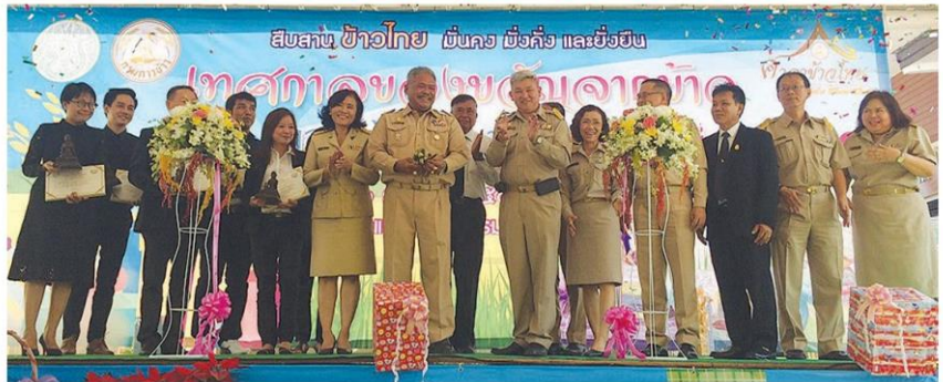
ผู้บริหารร่วมเปิดงาน