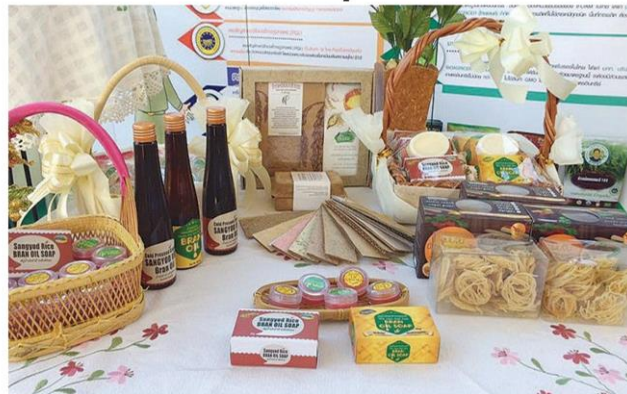
แปรรูปเป็นหลากหลายผลิตภัณฑ์

ของเกษตรกรและผู้ประกอบการ ซึ่งเป็นอีกช่องทางในการช่วยเหลือชาวนาที่ประสบปัญหาการตลาดข้าวตกต่ำให้มีแหล่งจำหน่ายสินค้าสู่ผู้บริโภคโดยตรง