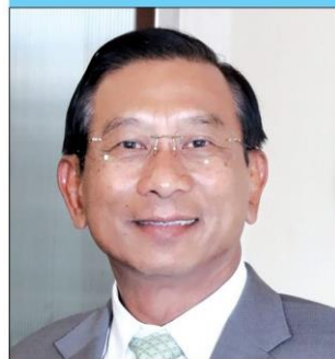
พล.อ.ฉัตรชัย สาริกัลยะ