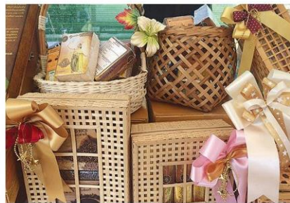
ในบรรจุภัณฑ์สวยงามแบบไทย ๆ

ต่าง ๆ ให้ได้อร่อย และมีการแจกผลิตภัณฑ์อาหารแปรรูปจากข้าวให้ผู้ร่วมงานชิมฟรี มีบริการรถโมบายยูนิตสำหรับให้ความรู้ ปรัชญาปัญหาโรคและแมลงในการปลูกข้าวด้วย